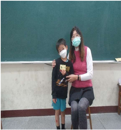
說明：學生賴 0 允，數學的能力不差要多做練習加強國字的識字率和多閱讀並加強專注力也要強化學習積極度定可以進步