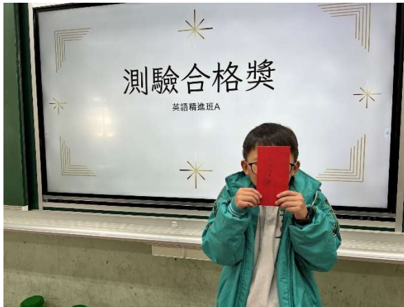
學習扶助評量成績合格獎