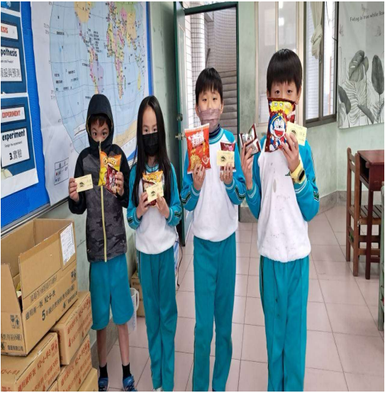
努力認真獲得合作社禮卷