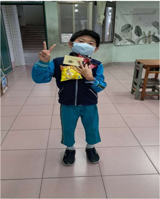
說明：勤奮獎~全勤的孩子最帥氣呦！！