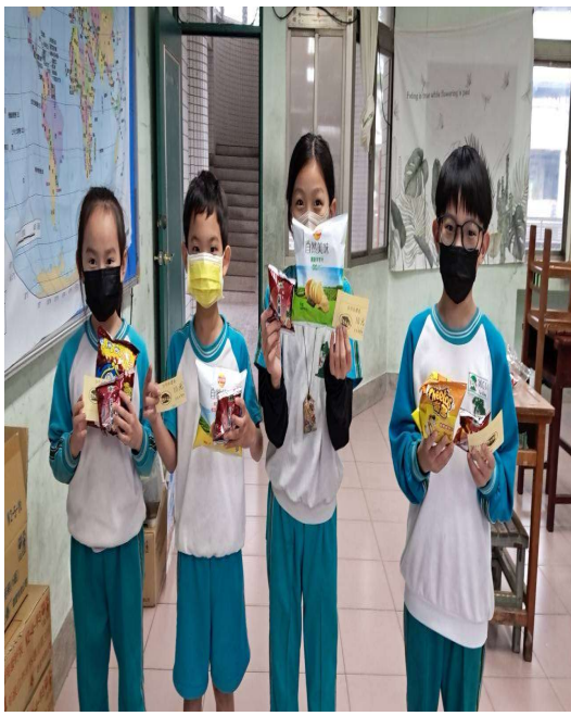
說明：優學獎~超認真努力的孩子最漂亮喔！！