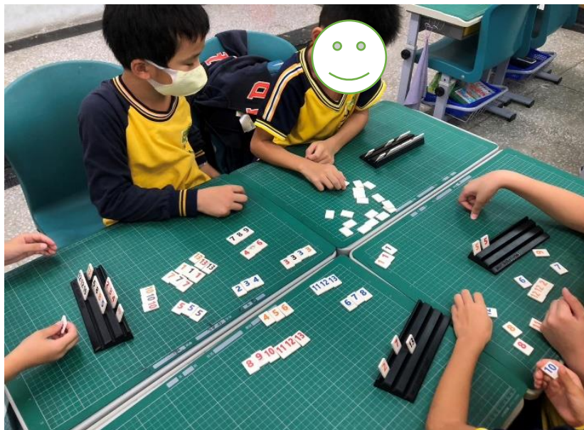
說明：(11312)透過桌遊提升學生數學能力