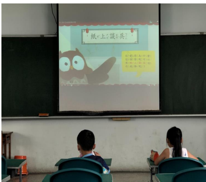
說明：(11307)利用影片進行成語認讀