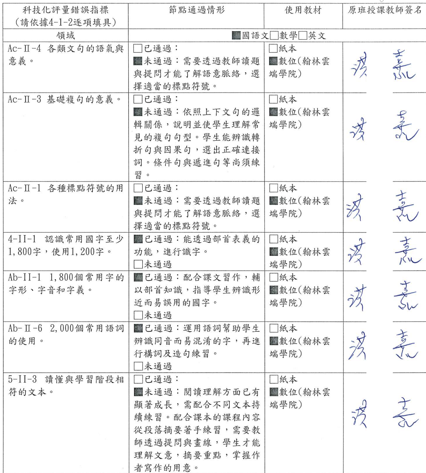
表4-3 未入班個案學生個人(李橘智) 學習扶助進度表