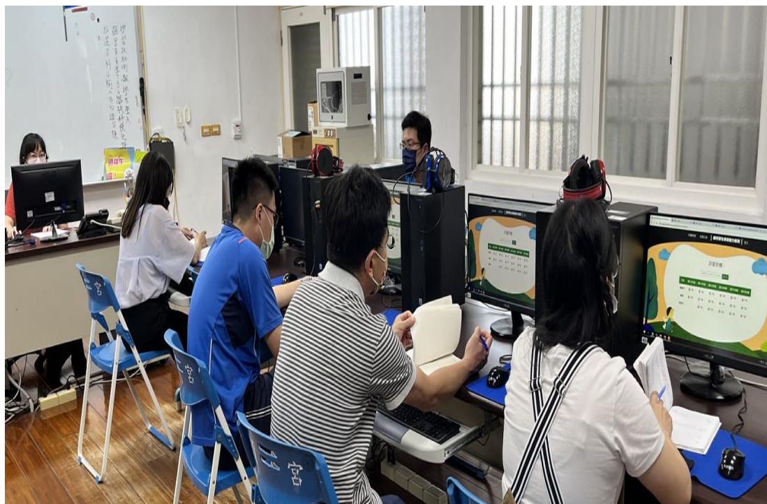
說明:113.10.1 辦理學習社群，邀請校內所有教師共同討論學生學力檢測成績，規畫學習課程及教學策略