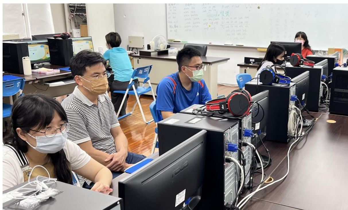
說明:114.5.6 辦理學習社群，邀請校內所有教師共同討論學生學力檢測成績，規畫學習課程及教學策略