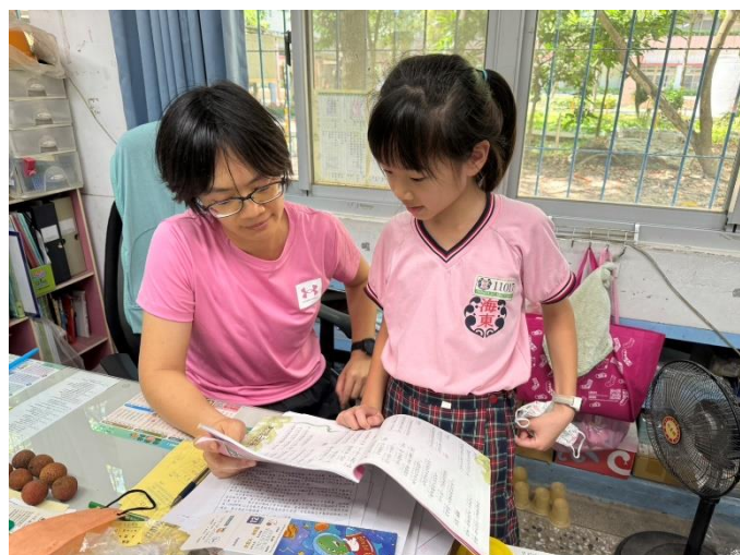
說明：對於未入班學生特別追蹤輔導 2