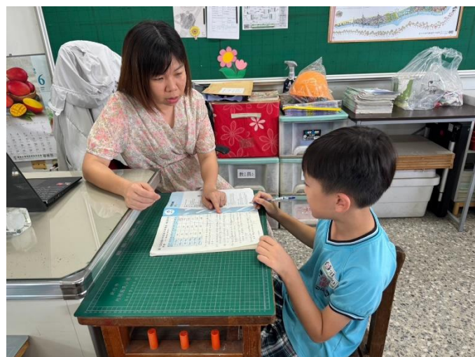
說明：對於未入班學生特別追蹤輔導 1