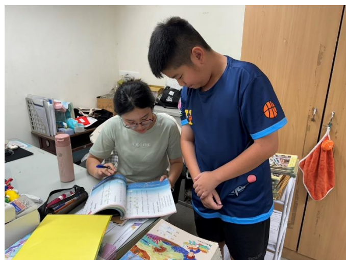
說明：對於未入班學生特別追蹤輔導 4