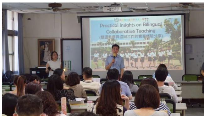
說明：辦理雙語教學在教學實務上的應用 114.3.26 大辦公室