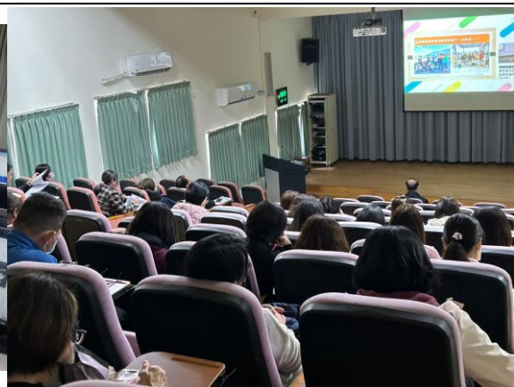
說明：辦理課中差異教學分享會直播研習 114.2.12 視聽教室