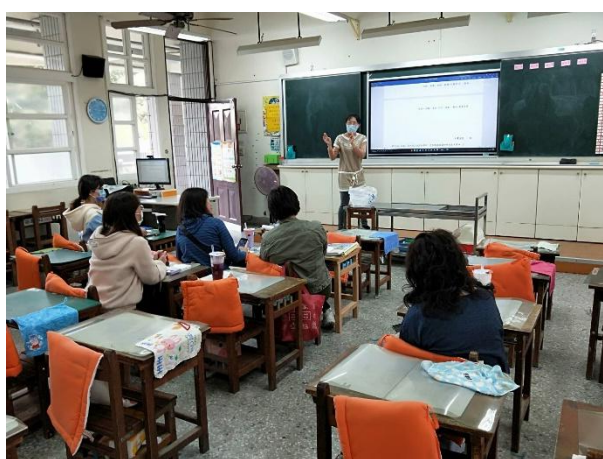
說明：學扶教師授課經驗交流分享