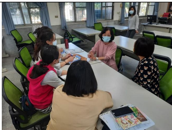
說明：學年教師共備課程，經驗交流分享。