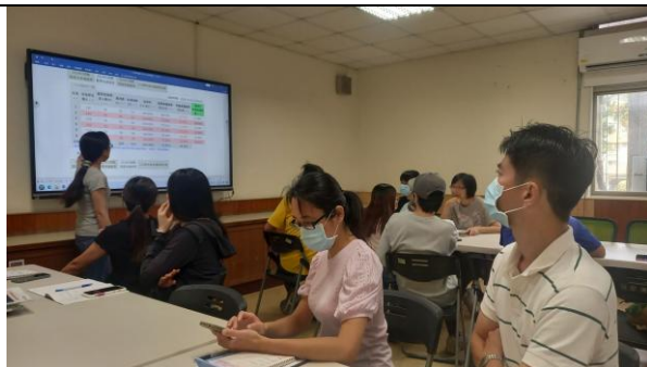
說明：辦理學習扶助業務說明會 113.10.14 小會議室