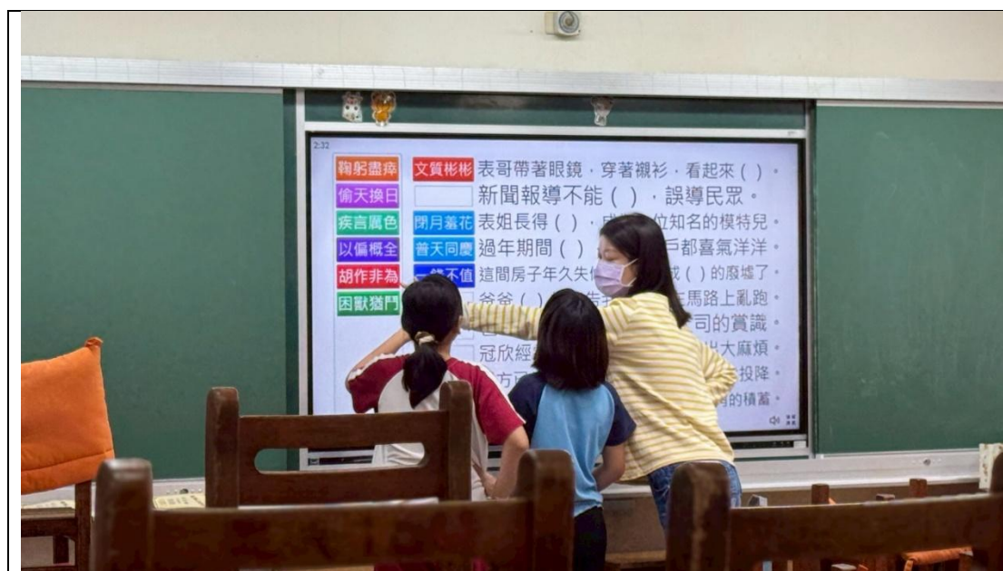
成語教學時，教師透過引導孩子了解成語意義解題。