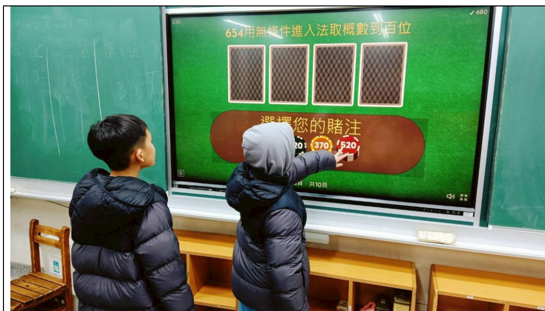
本校教師利用籌碼教學增加學生學習興趣，跳脫過往傳統教學。