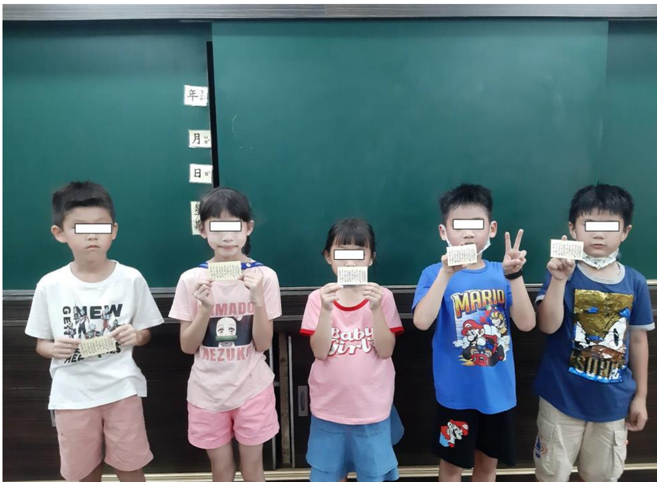
◎公開表揚學習優良、全勤獎和進步獎！