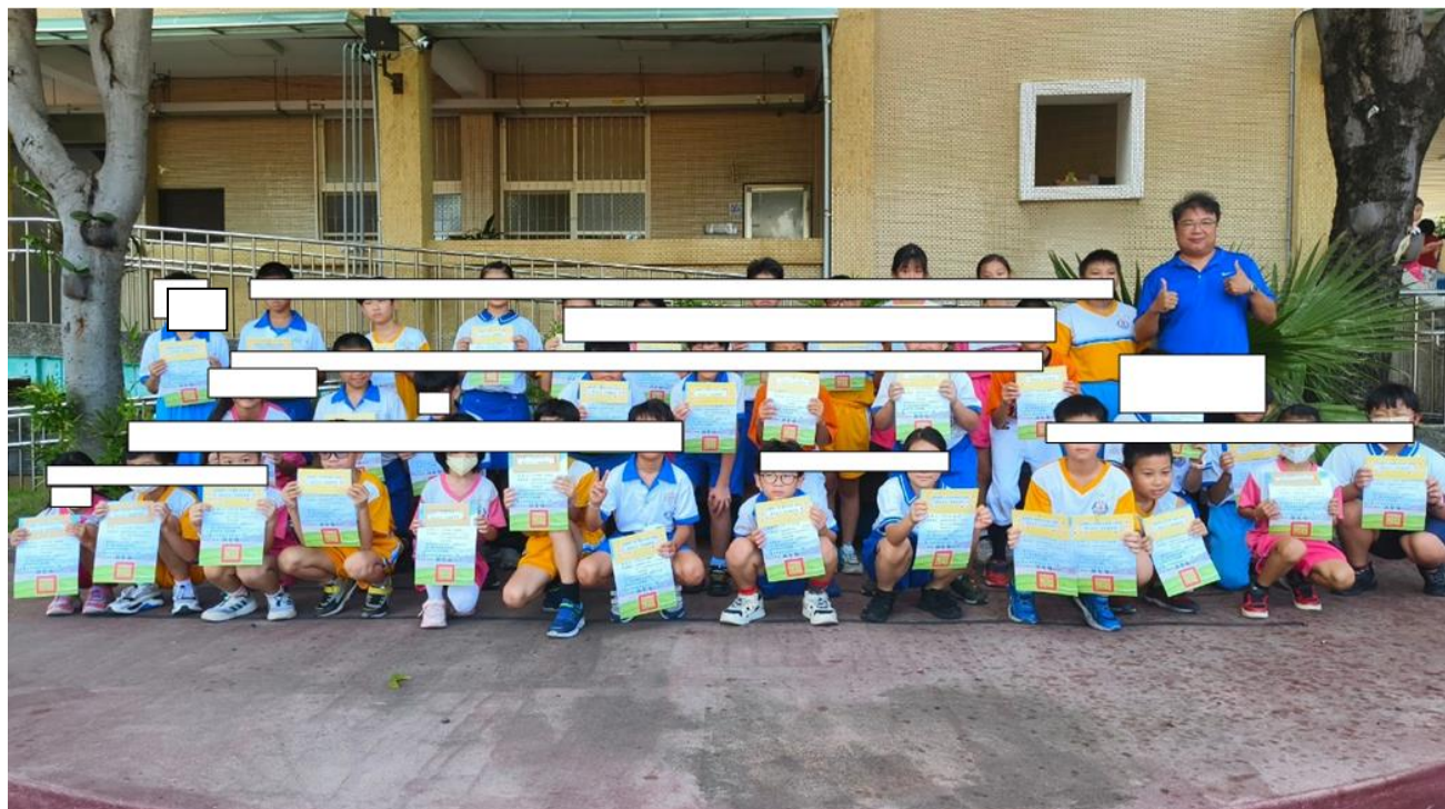
◎篩選測驗和成長測驗成績優良通過測驗獎勵！