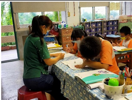
說明：個別指導學生弱項科目