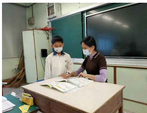
說明：個別指導學生弱項科目