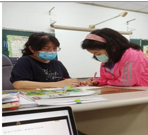
說明：個別指導學生弱項科目