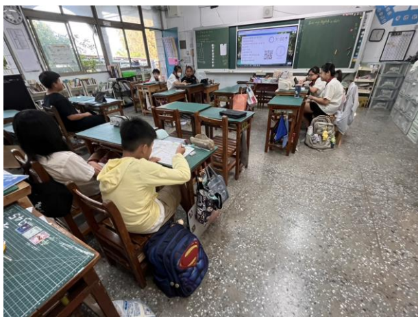
學生運用平板自學