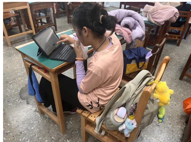
教師進行數學指導與釐清觀念