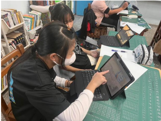
運用教學平台 KAHOOT 輔助學習