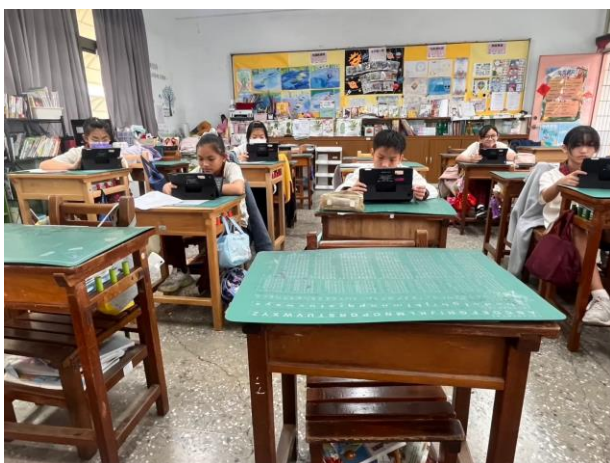
運用線上平台因材網輔助學習