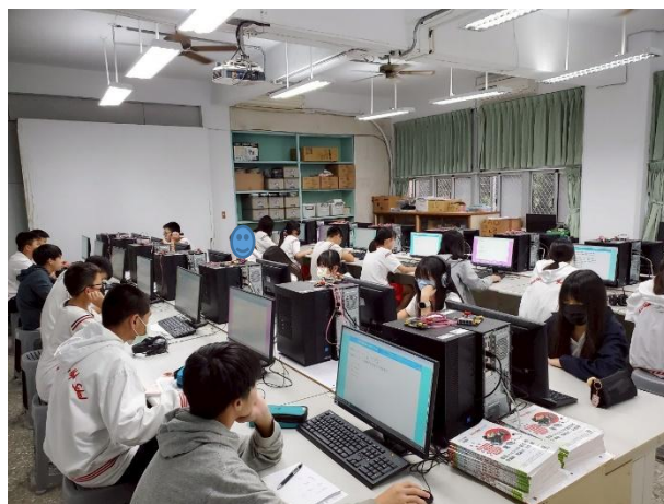
說明：篩選測驗施測過程認真聆聽解說 並能專注作答