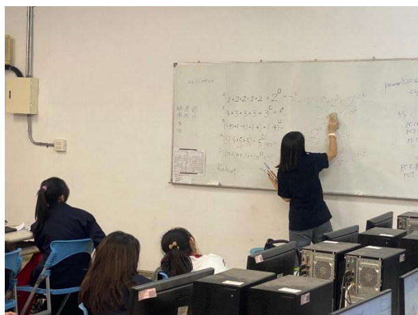
說明：多樣化課程設計－ 數學科電腦教室上機操作因材網 教師講解迷思概念