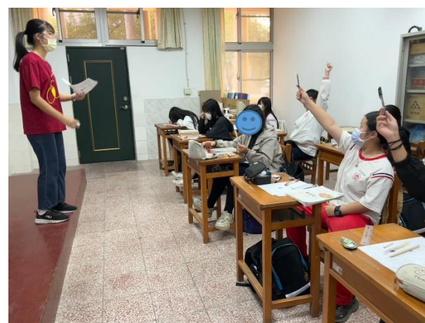
說明：多樣化課程設計- 英語科精美 PPT 課程內容引起學生注意