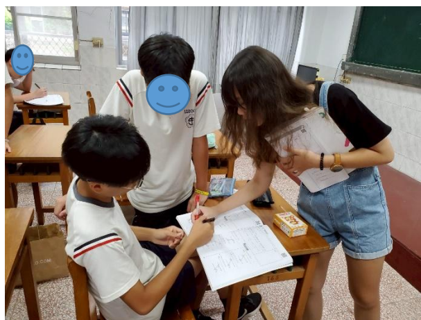
說明：多樣化課程設計－ 安排「數學科小幫手」協助指導同儕