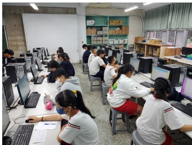
說明：成長測驗施測過程認真聆聽解說 並能專注作答