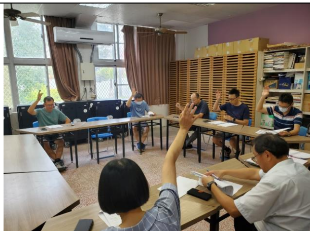
特殊原因入班表決