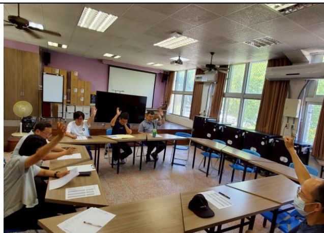
特殊原因結案表決