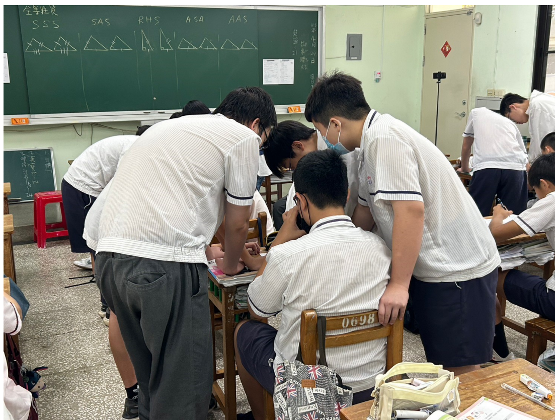
學生分組時間，由 A 組同學帶 B 組同學討論