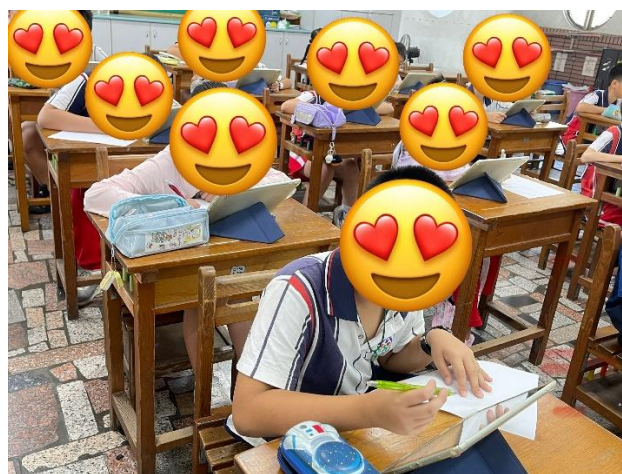
學生進行數學測驗時，使用白紙、筆計算。