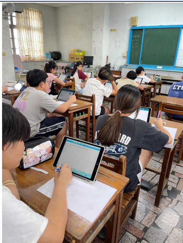
學生進行數學測驗時，使用白紙、筆計算。