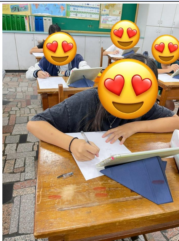
學生進行數學測驗時，使用白紙、筆計算。