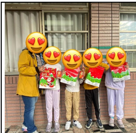
說明：課堂中，獎勵受輔進步的學生。