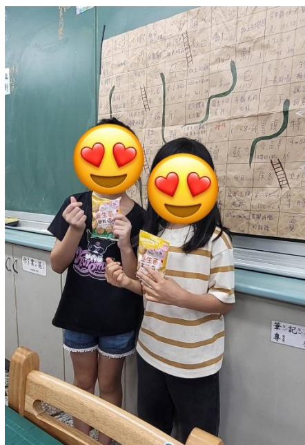
說明：課堂中，獎勵受輔進步的學生。