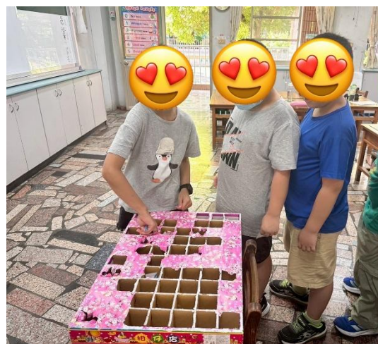
說明：課堂中，獎勵受輔進步的學生。