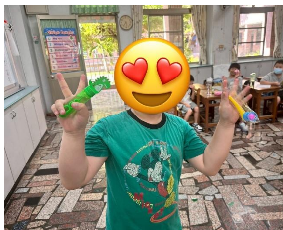
說明：課堂中，獎勵受輔進步的學生。