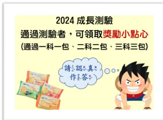
成長測驗現場張貼的獎勵海報

針對所有參加科技化評量學生(含5月篩選、12月成長)，為鼓勵學生正面作答並且提升答對率，除了請級任老師提醒「認真作答」外，於施測現場亦提供小獎勵，凡測驗合格，作答後立即發放。