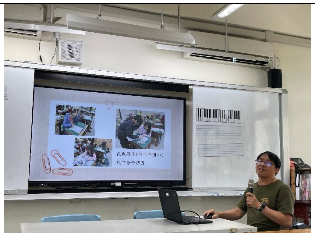
教師社群-進行課後反思分享