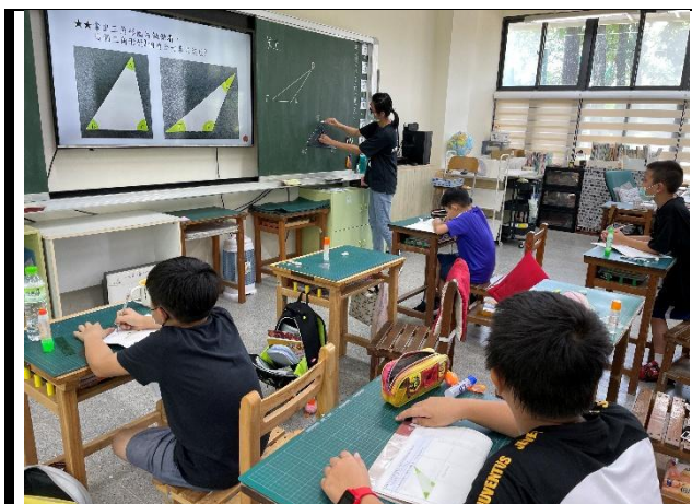
五年級數學科差異化教學公開授課