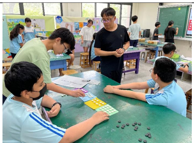
六年級數學科差異化教學公開授課