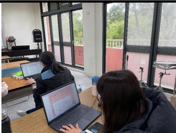
高年級教師社群共備:研討數學差異化教學教學設計