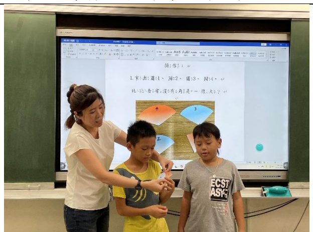
三年級數學科差異化教學公開授課