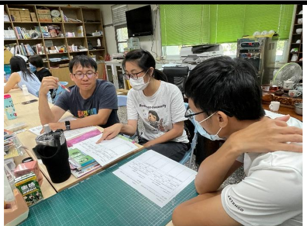
教師社群:數學科教師進行公開授課前的說課