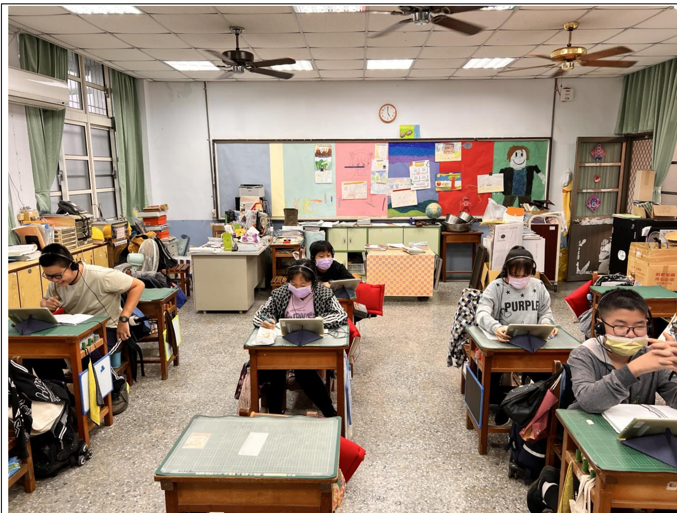
說明：英語學習扶助使用平板進行學習。