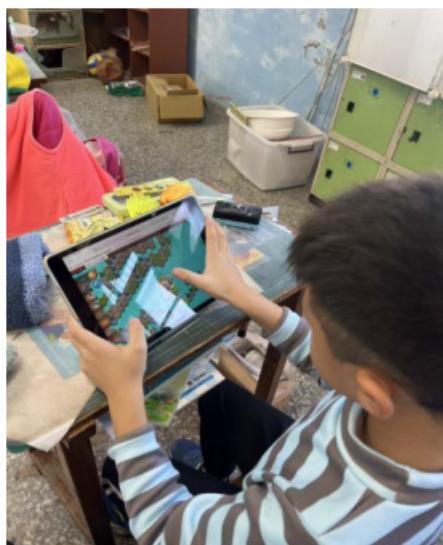
說明：使用 pagamo 進行學習。