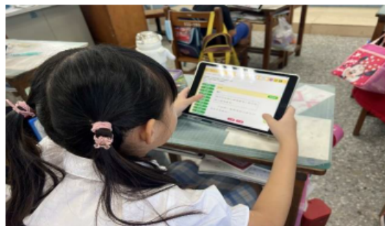
說明：使用因材網進行學習。