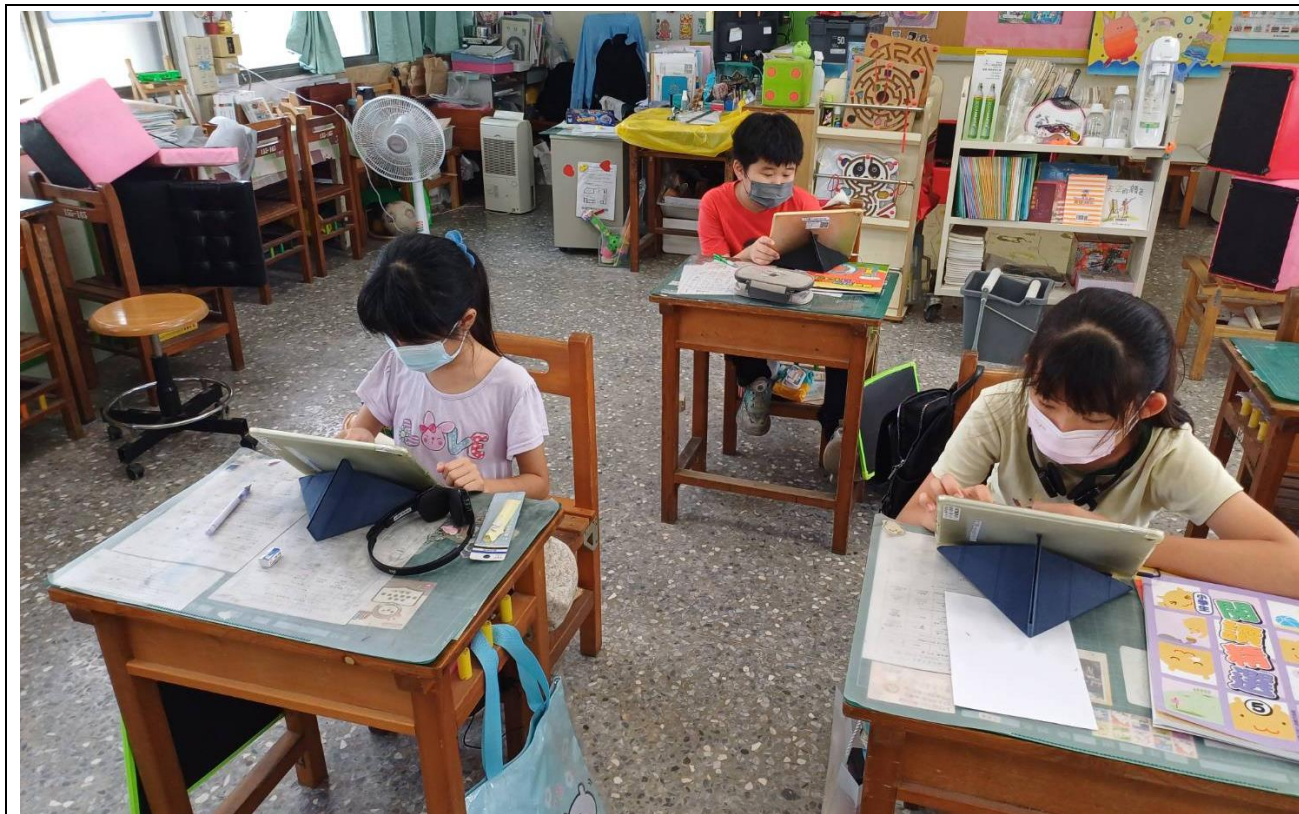
說明：平板進行因材網自學