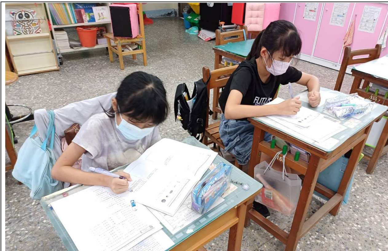
說明：結合紙本自學