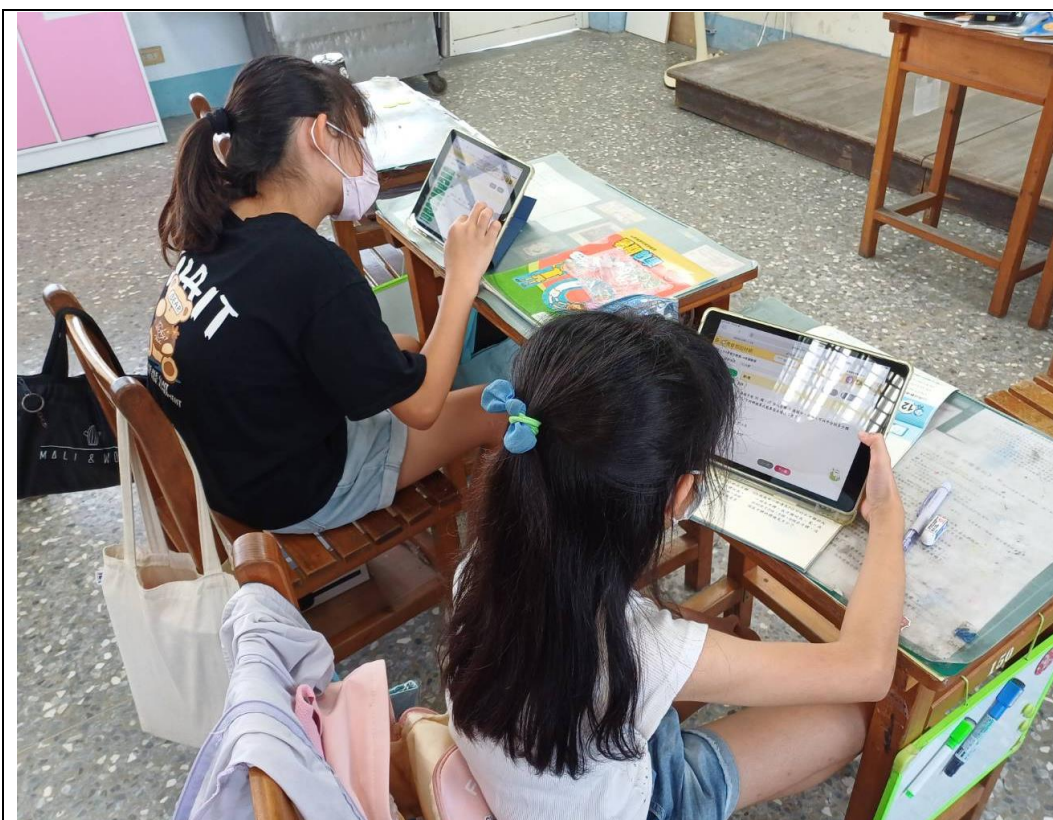
說明：自學後，開始測驗。