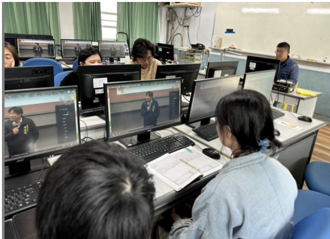
說明：113 學年度第 2 學期數位融入課中差異化教學分享會之線上研習 日期：114.02.26