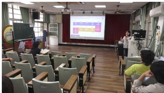
說明：學思達：備一堂孩子喜歡，且有效的 課之教師增能研習 日期：114.04.16