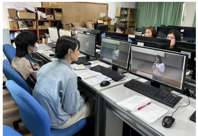
說明：113 學年度第 2 學期數位融入課中差異化教學分享會之線上研習 日期：114.02.26