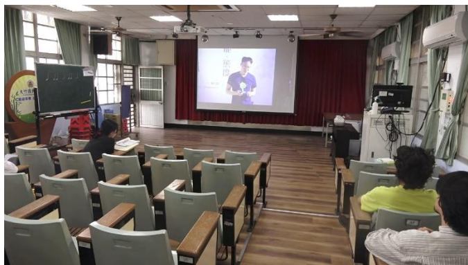
說明：學思達：備一堂孩子喜歡，且有效的課 之教師增能研習 日期：114.04.16