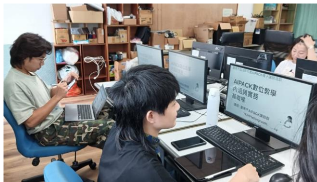
說明：AIPACK 數位軟體融入教學之增能研習 日期：114.03.05