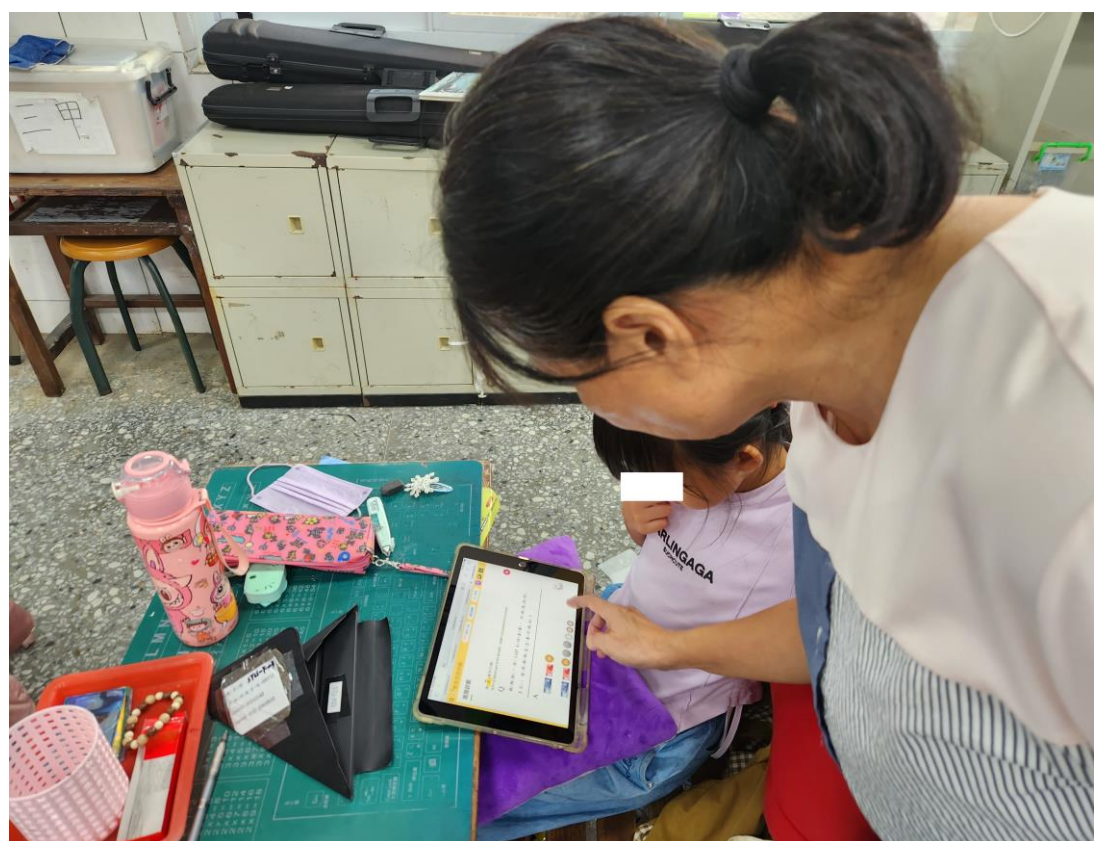
教師協助學生解決平臺上問題