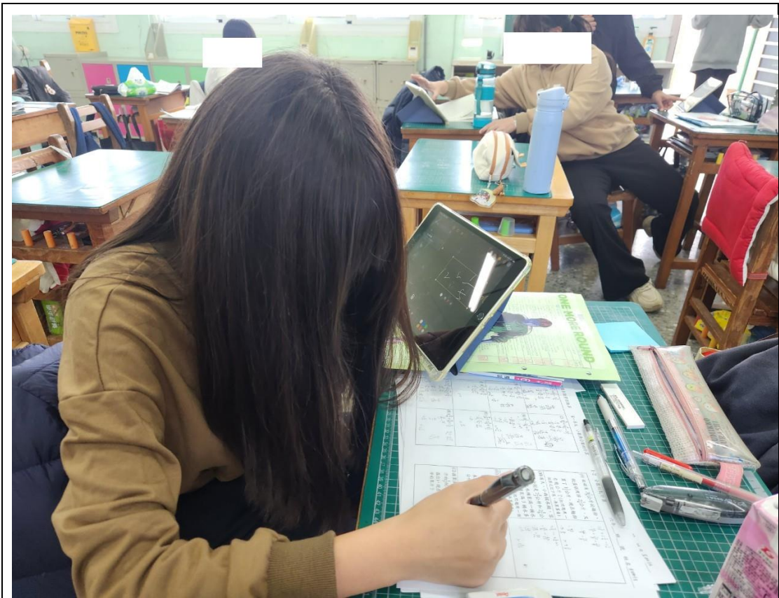
教師製作學習單搭配平臺使用