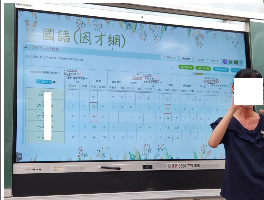
國語科目教師依課文學習重點搭配因材網上任務節點給予學生語文練習。