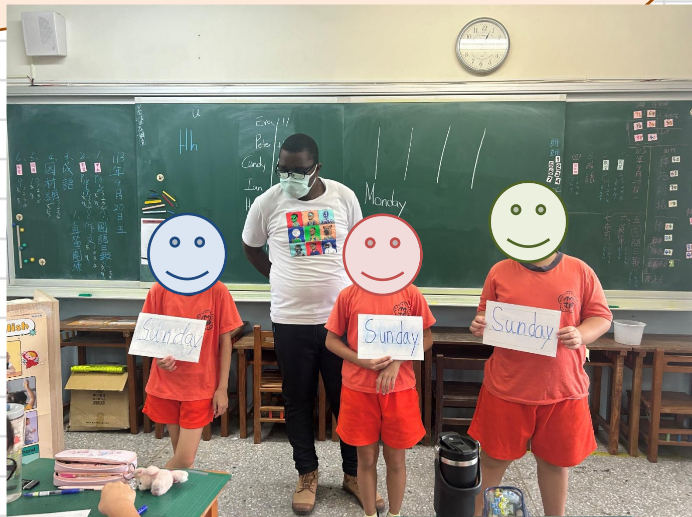
外師邀請學生到台上發表