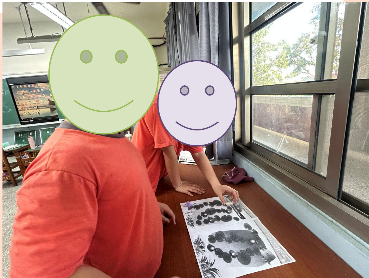
☆利用大富翁遊戲，複習發音☆