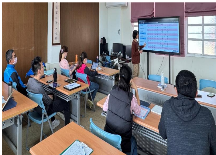
說明:觀看學生的測驗結果