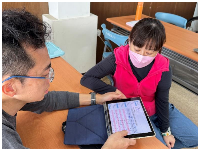
說明:了解學生的測驗歷程，並針對未通過指標做進一步討論