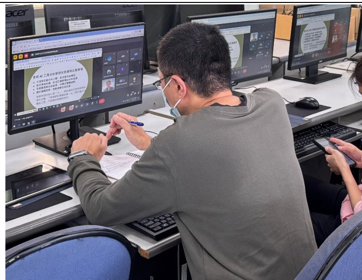
說明:線上課螢幕畫面截圖

說明:使老師知道如何使用 NotebookLM 的核心功能，可以在課堂中簡單又有效地應用