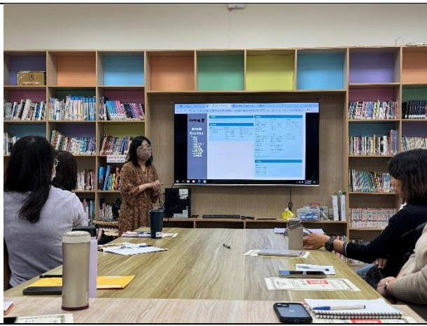
王乃玉老師說明如何利用 PBL 增進學習