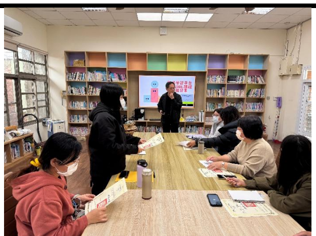
校長分享數位學習經驗