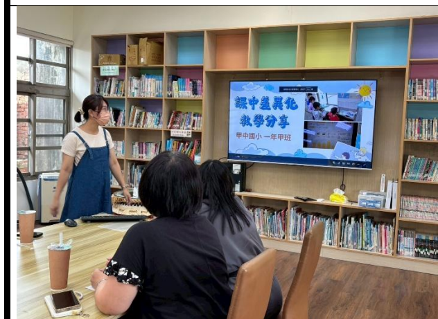
老師進行課中差異化教學分享