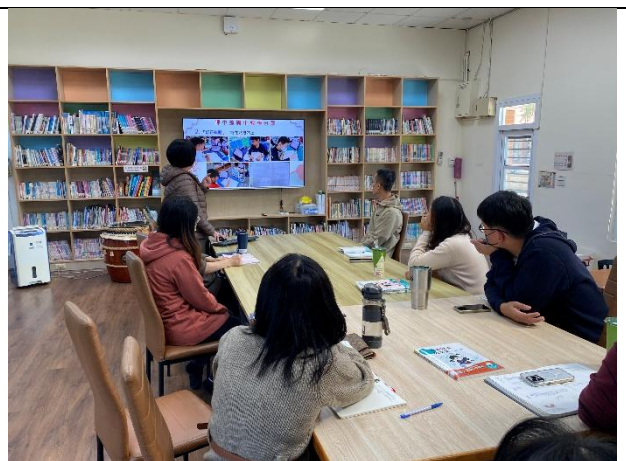
中年級運用數位課程進行學習扶助差異化教學