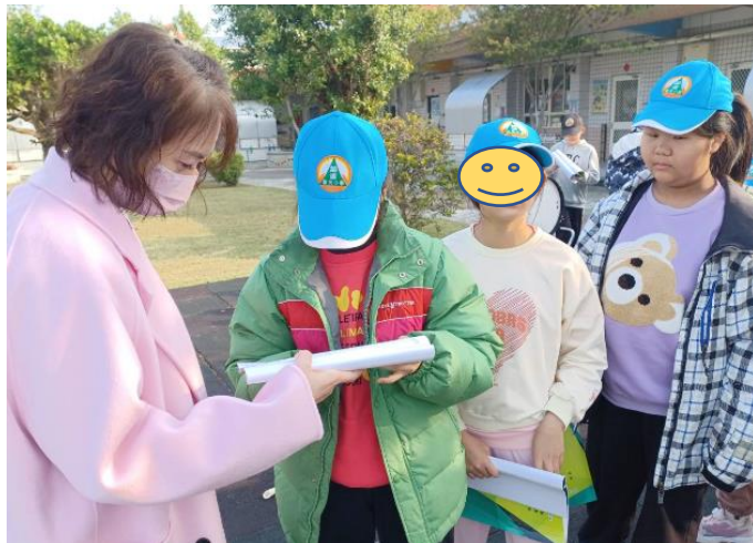
英語闖關活動多一次練習機會