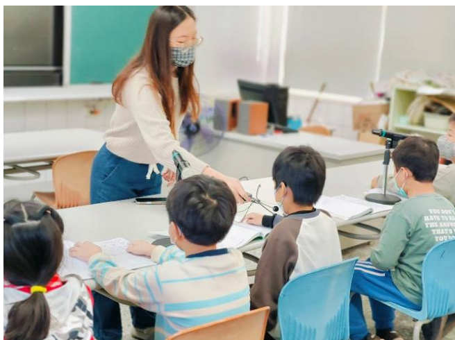
每天英語廣播磨練學生聽力