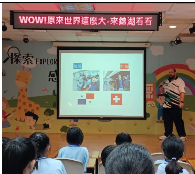
認識巴拿馬及瑞士