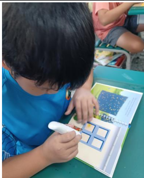
晉基建設閱讀推廣，讓學生樂愛閱讀。