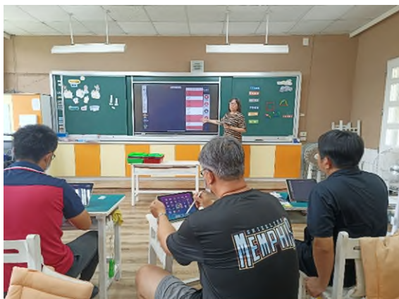
說明：113.11.06 Loionote 軟體融入教學分享。