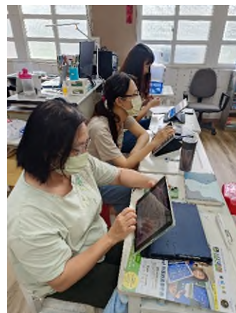
說明：113.11.06 Loionote 軟體融入學習扶助課程設計