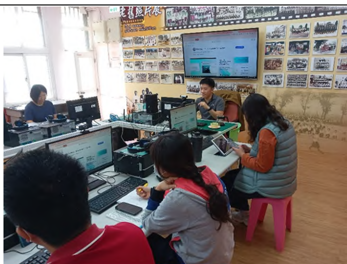
說明：113.11.27 AI 融入學習扶助教學的應用。