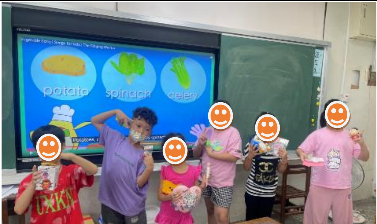
說明：利用經費購買獎品，讓學生可兌換禮物，以提升學習動機