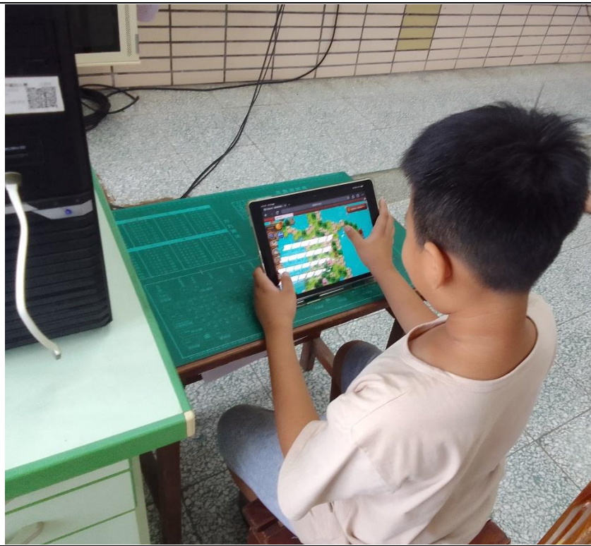
說明：利用遊戲式學習平台「PAGAMO」增進學生學習的動機