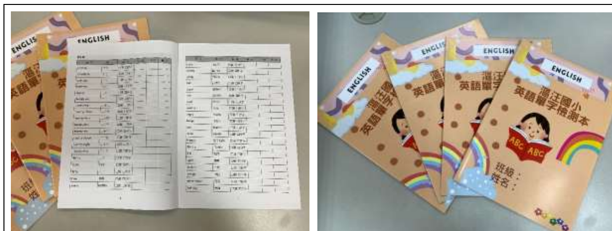
學校自編英語單字檢測本，鼓勵學生熟記基礎單字