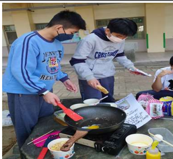
教學生一邊烹飪一邊練習英語