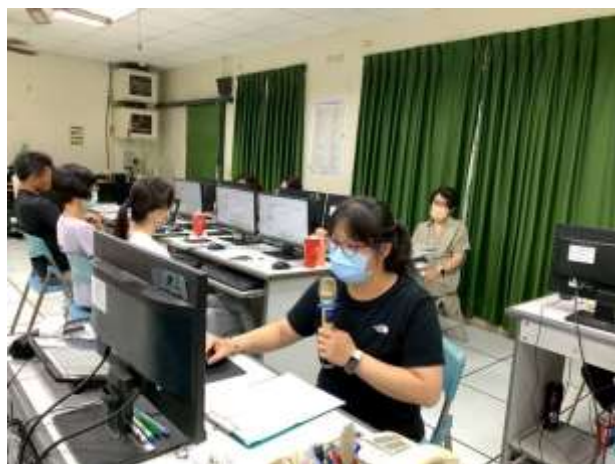
114. 06. 04 使用均一平台進行數學科教學，教師介紹平台使用方式