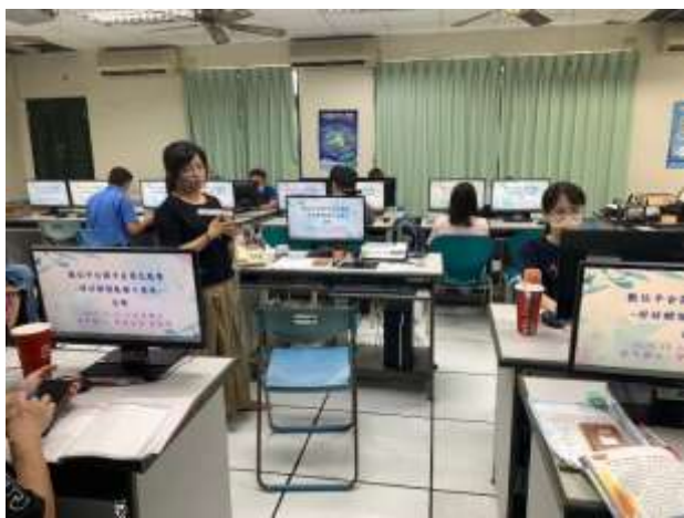
113. 10. 30 老師分享數位工具在教學上的運用、老師實際操作