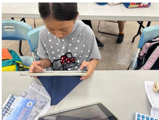
6/11 陪伴學生剪輯畢業影片