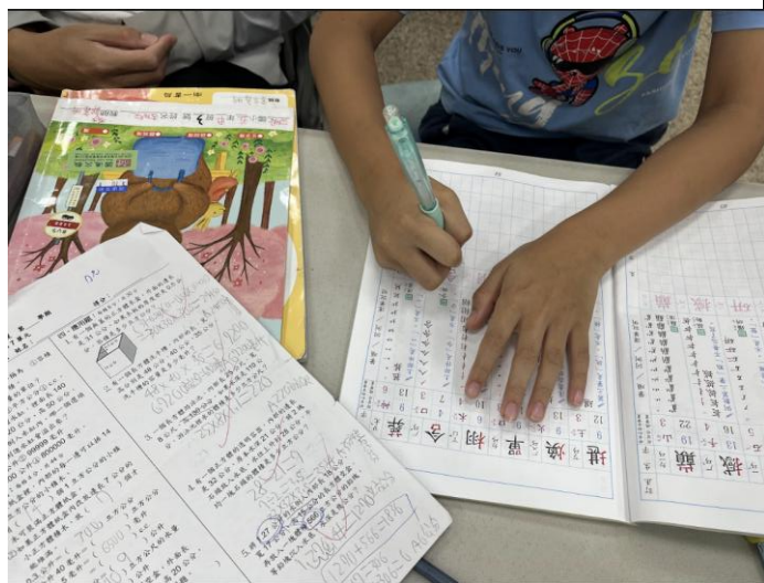
5/21 指導學生寫國語生字本