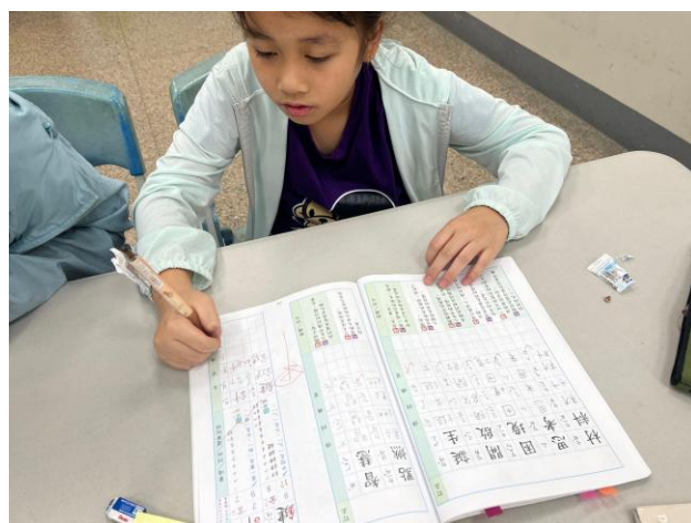
6/11 指導學生完成國語作業