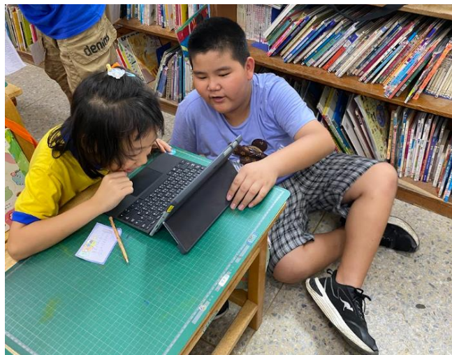
有學長協助更加安心