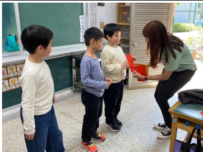
認真的孩子校長有特別的獎勵