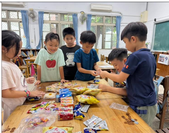
期末用榮譽幣換心愛的獎勵品