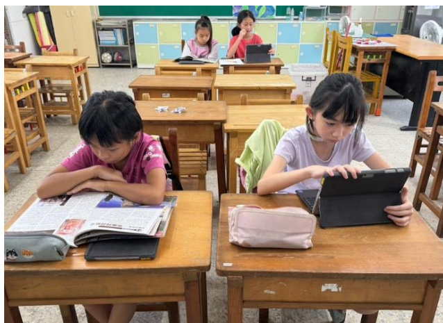
利用數位工具學習