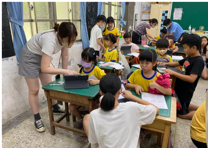
大手帶小手練習使用數位工具