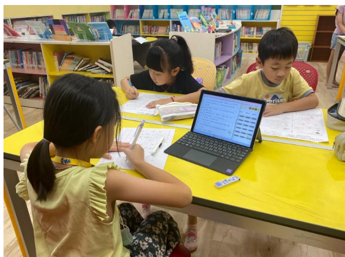
在圖書館裡上課好舒服