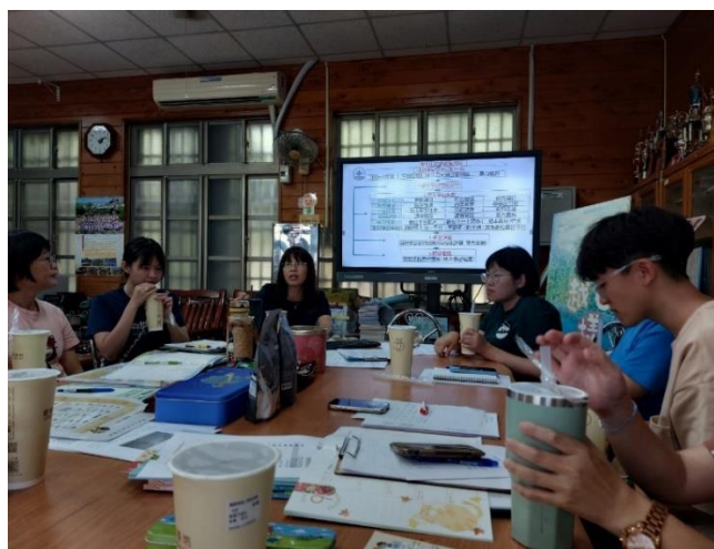
說明：運用差異化教學提升學生學習力