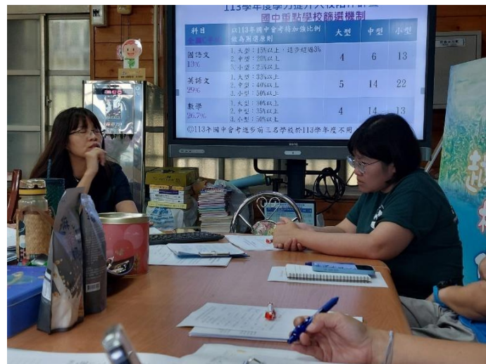
說明：學力篩選機制、討論學習策略