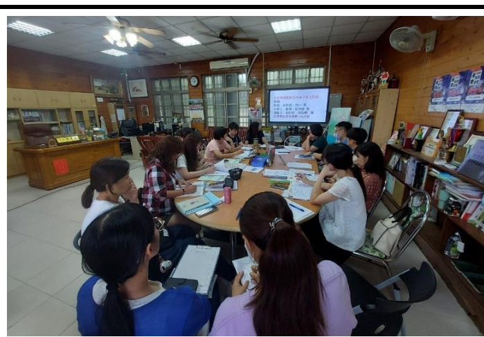
說明：介紹因材網、學習吧、Cool English等網站平台