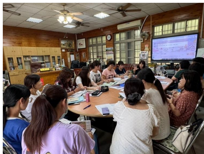
說明：如何使用學習扶助網站平台資源