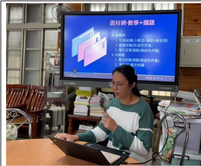
教師分享如何利用因材網準確進行學習扶助