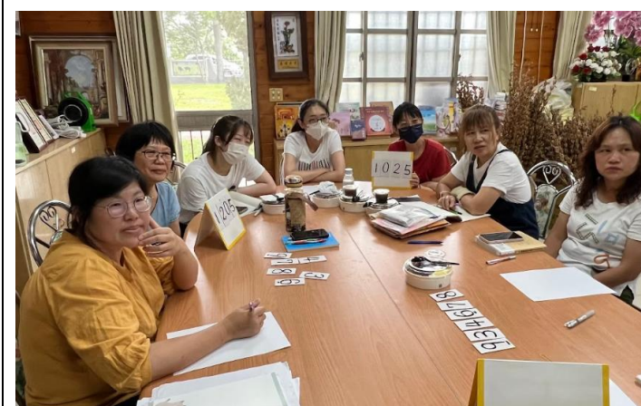
老師分享如何從遊戲中學習數學