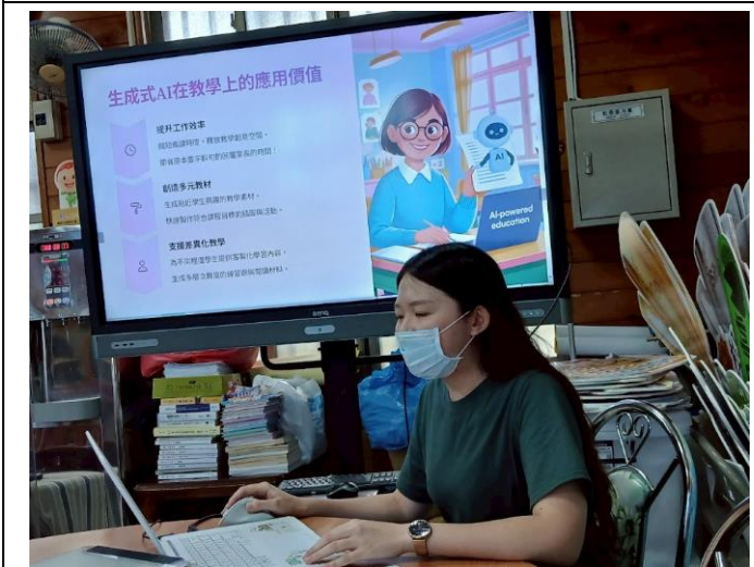
教師分享如何 AI 輔助學習扶助的進行