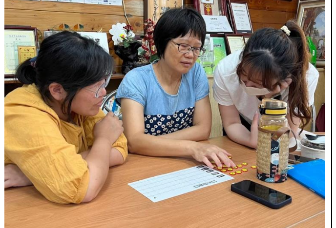
老師一起進行遊戲體驗學生的思考邏輯