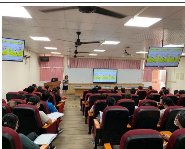
差異化教學影片線上研習說明