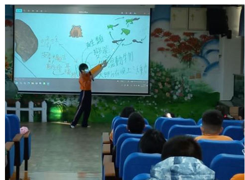
個案學生參與心智圖海報的製作並向全校進行解說(五甲 江00)