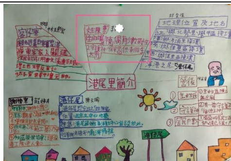
個案學生參與心智圖海報的製作能有自信寫出自己蒐集到的資料