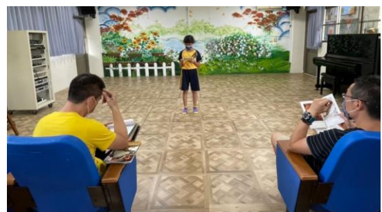
參加英語朗讀比賽，能完整唸完讀本 (四甲李00)