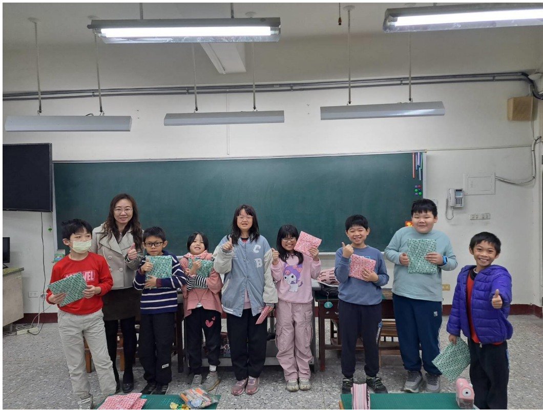
學期末辦理學習態度楷模獎