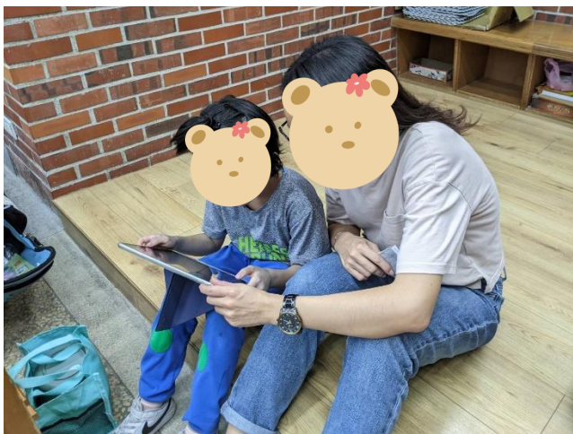
2/18 說明：一對一指導學生作答。