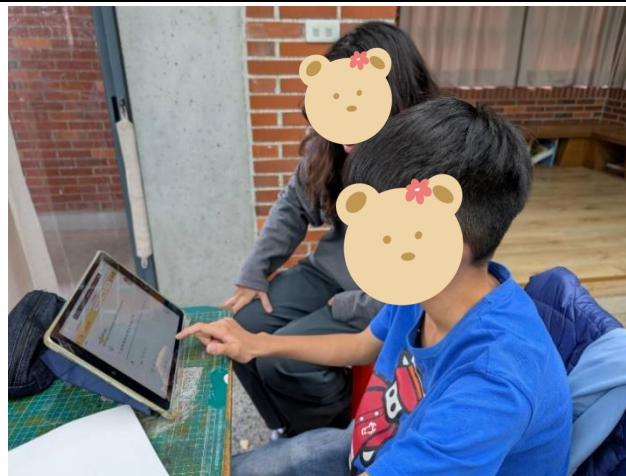
10/14 說明：利用因材網練習，加深學生的學習概念