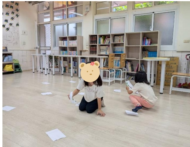
9/20 說明：運用活動增強學生對學習的興趣