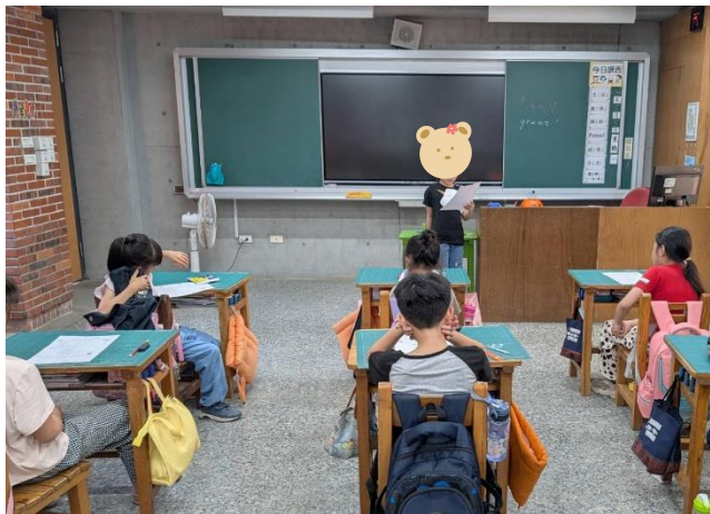
3/11 說明：學生向同學分享數學解題方式