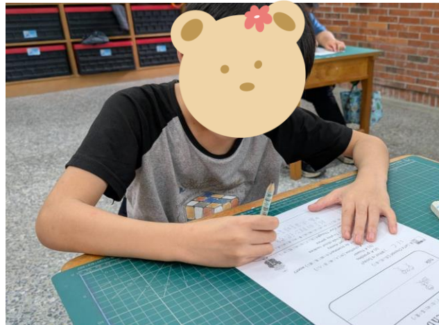
4/8 說明：針對學生較弱的概念以學習單複習