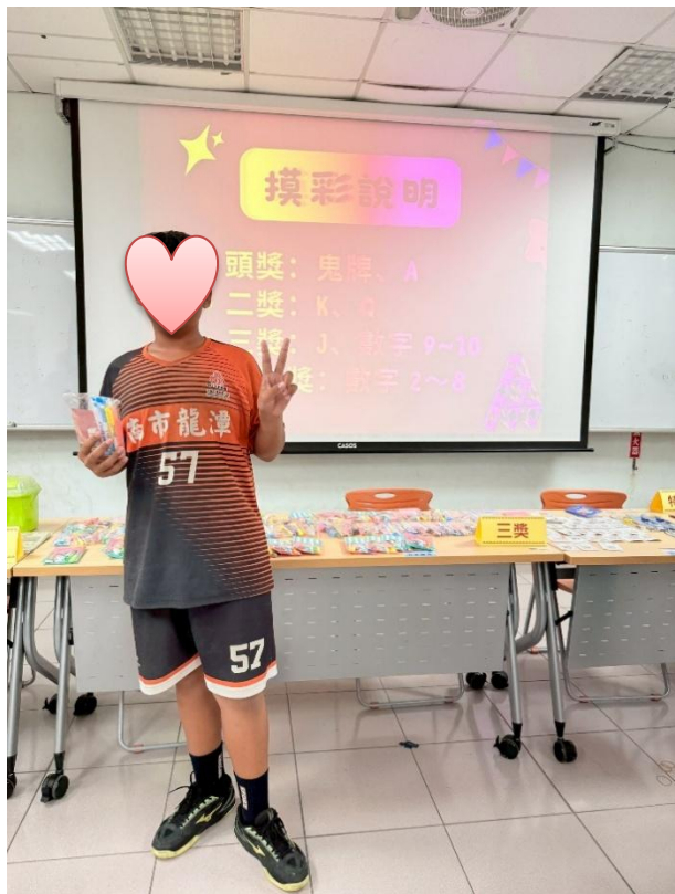
說明：表揚參加學習扶助表現優良學生 ～學生喜獲獎項