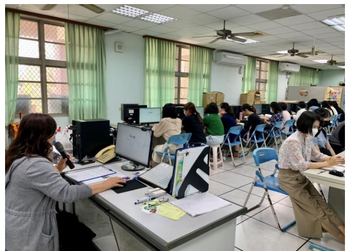
校內學習扶助科技化評量系統研習 114/03/05