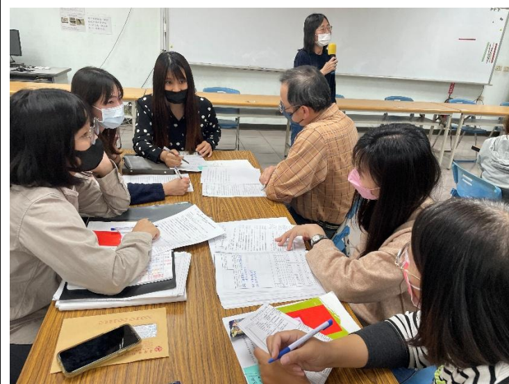
學習扶助社群會議— 學生學習成效探究與教學策略修正 114/12/25