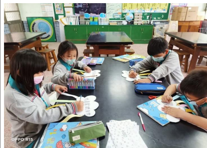
華語補救教學—識字教學策略 114/12/04