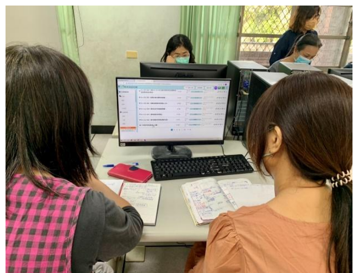
依照科技化評量數據進行目標學生弱點分析— 學習如何應用因材網節點補救 114/03/05