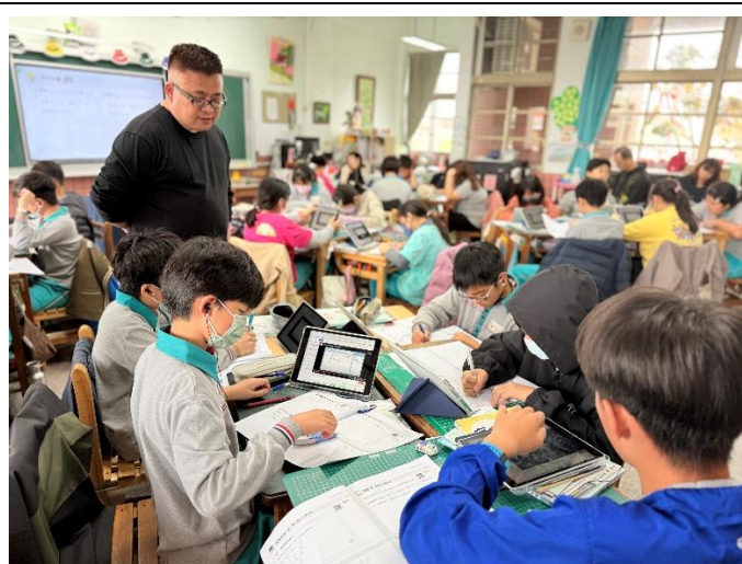
參與國教署差異化教學團隊-公開授課