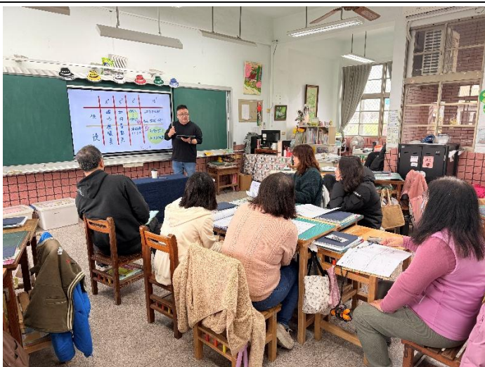
參與國教署差異化教學團隊-教師共備