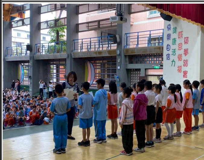
學習扶助進步學生

說明：校長於開學後頒獎表揚第二學期參與學習扶助且表現優良學生。- 整體學習表現優良及篩選測驗進步學生 。