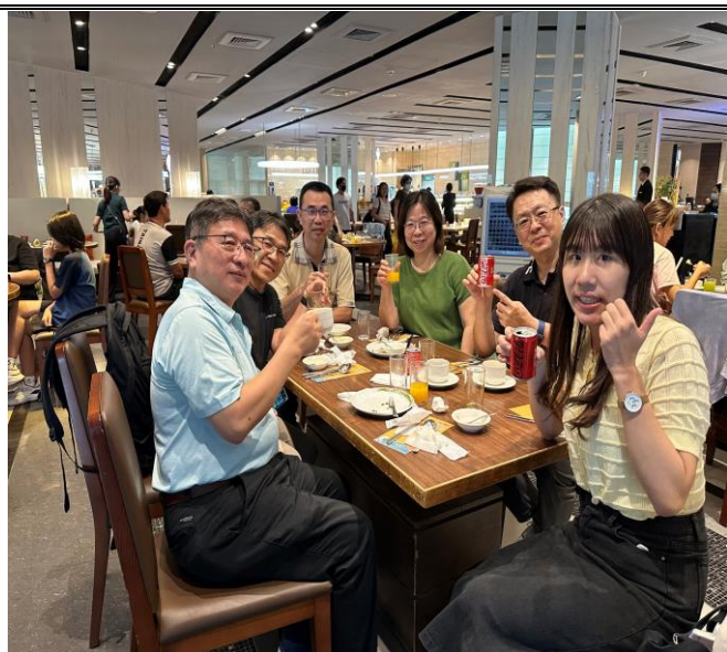
績優教師及行政人員

說明：校長、家長會長於教師晨會頒發感謝狀，公開表揚暑期中犧牲假期參與學習扶助的行政人員。