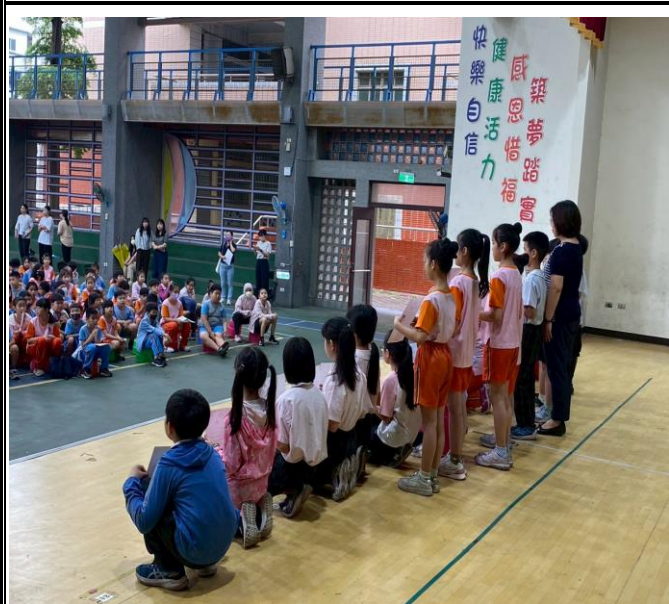
學習扶助進步學生

說明：校長於開學後頒獎表揚暑期中參與學習扶助且表現優良學生，並宣導學習扶助之重要性。一~五年級 全勤獎