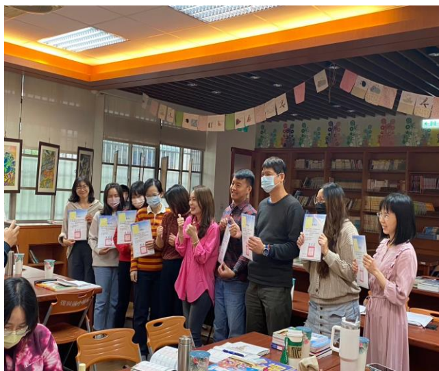
績優教師及行政人員