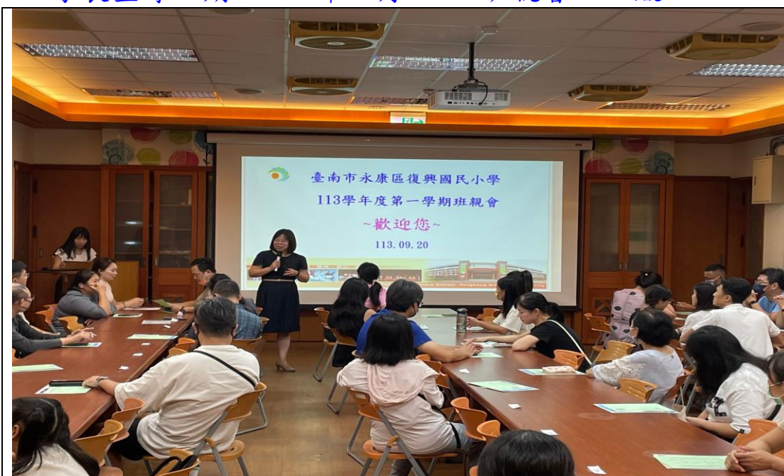
照片說明：校長於學期初班親會時向全校家長宣導學習扶助之計畫精神及內容。