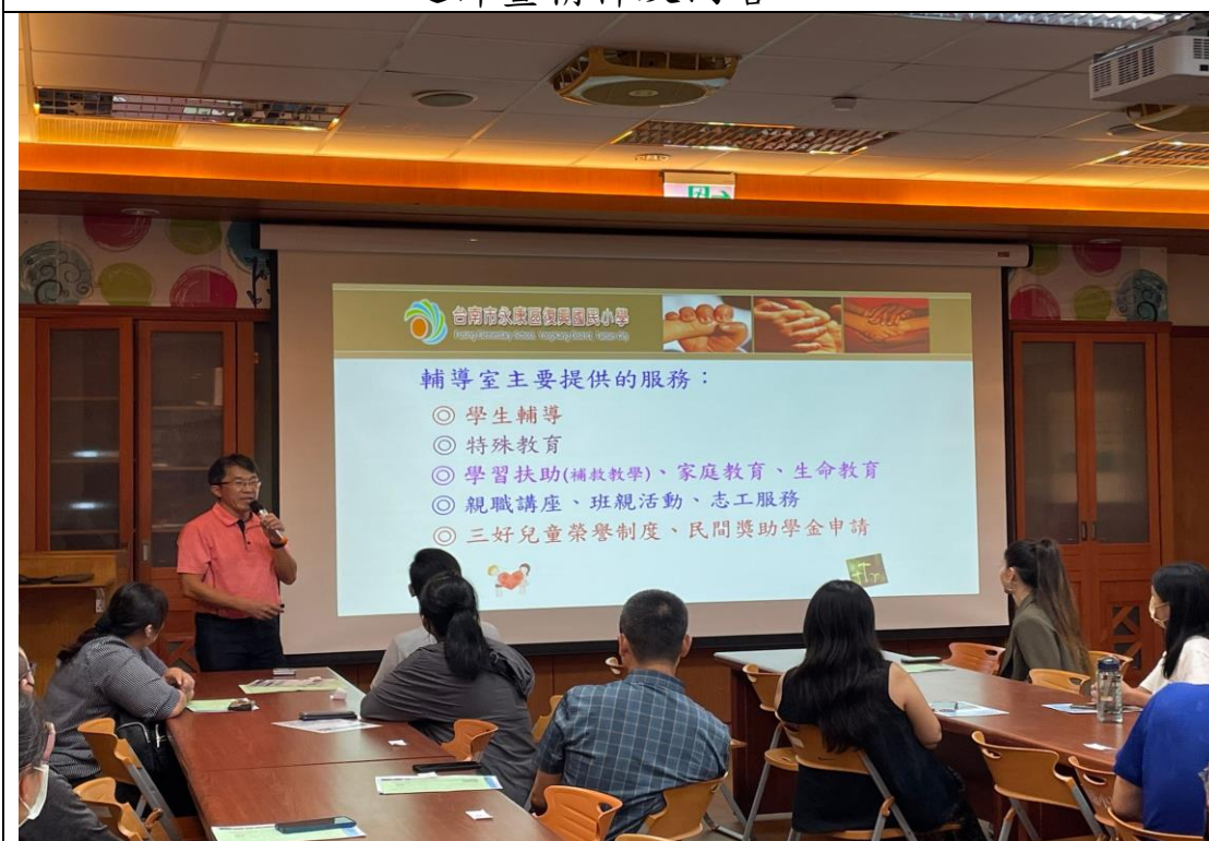
照片說明：承辦主任於班親會，向全校學生家長說明本校學習扶助實施計畫相關內容及開班情形。