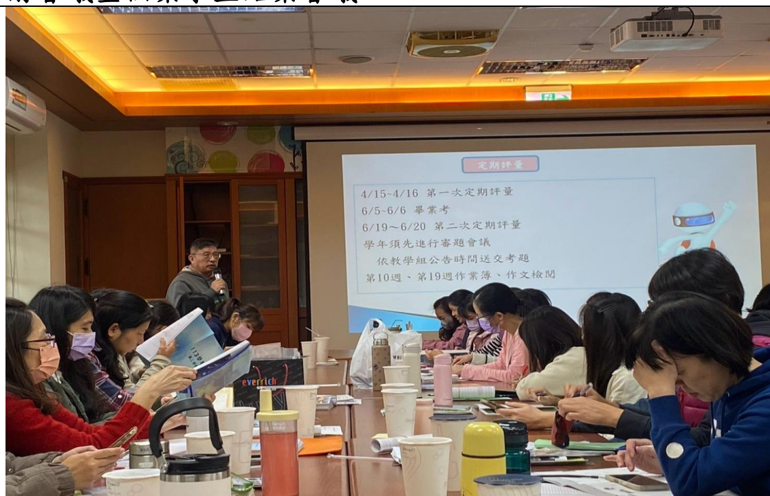
照片說明：校長主持 113 學年度第二學期期初-學習扶助開課前會議-教務主任說明學校行事曆及學習扶助方案調整內容。