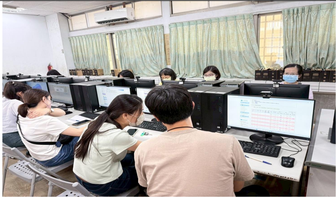
照片說明：113 學年度第 2 學期學習扶助篩選測驗結果分析暨線上教材說明-教師研習。