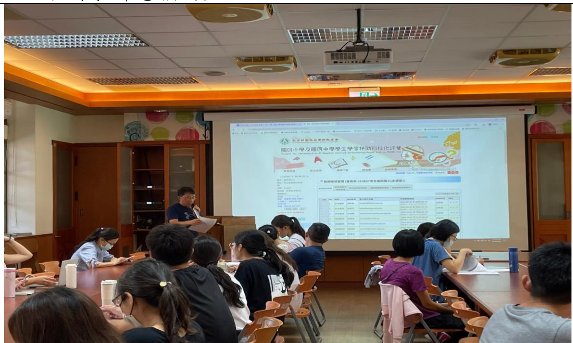
照片說明：承辦主任於教師晨會說明 5 月份學習扶助篩選測驗及授課教師意願調查。