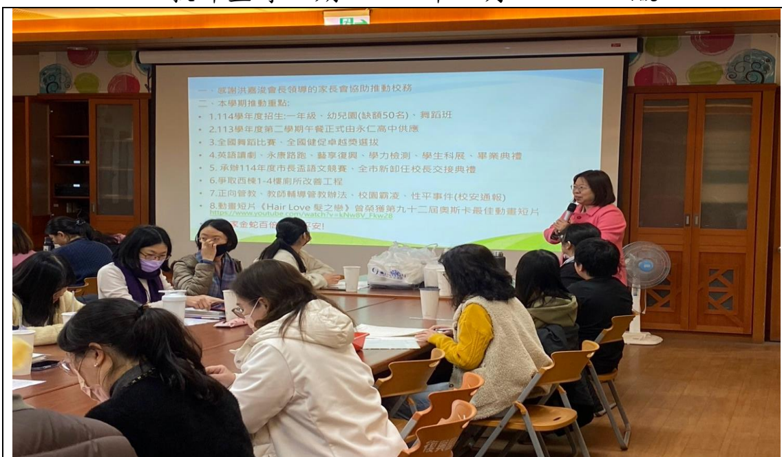
照片說明：校長主持 113 學年度第二學期期初-學習扶助開課前會議暨個案學生結案會議。