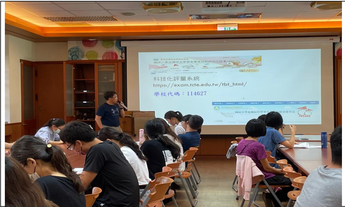
照片說明：承辦主任於教師晨會說明 5 月份學習扶助篩選測驗及授課教師意願調查。