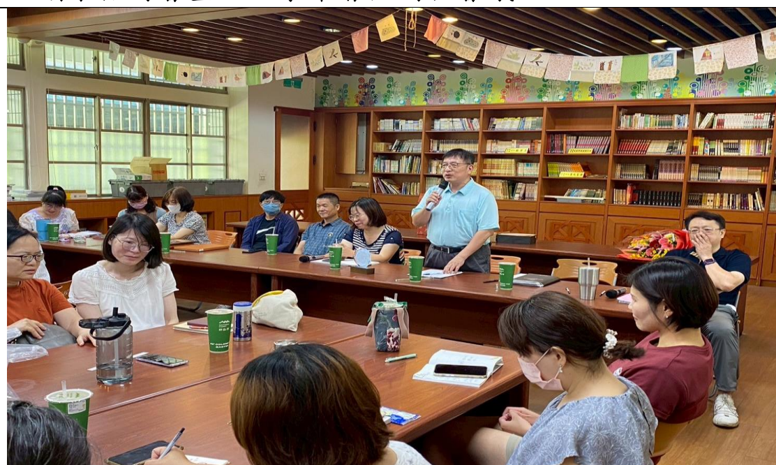
照片說明：校長主持 113 學年度第二學期學習扶助成果報告及期末檢討會暨 114 學年暑假開班會議，教務主任說明暑假夏日樂學及學習扶助開班授課情形。