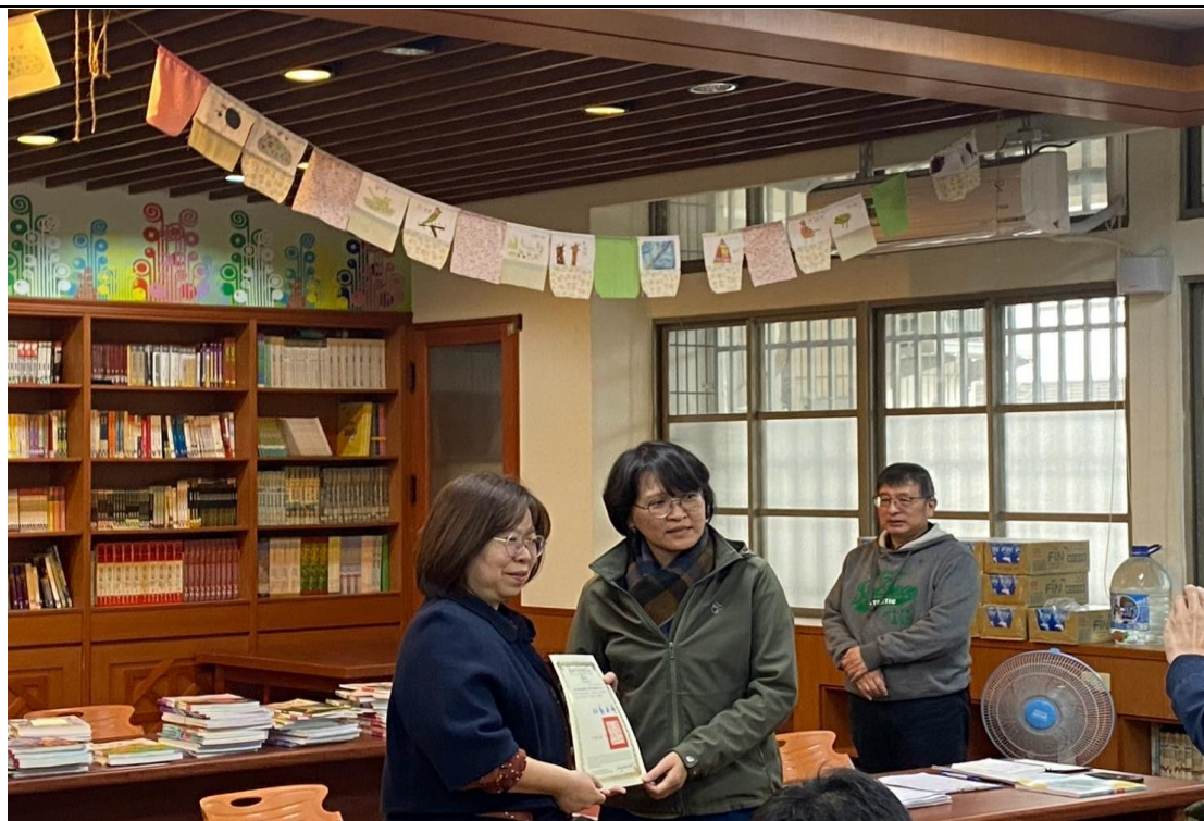
照片說明：校長主持 113 學年度第一學期學習扶助成果報告暨期末檢討會-頒獎感謝協助學習扶助的師長。