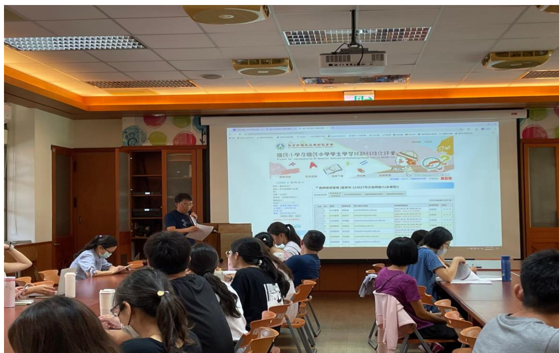
照片說明：校長主持 113 學年度第一學期期初暨學習扶助開課前會議-承辦主任說明學習扶助開課時間及受輔學生條件。