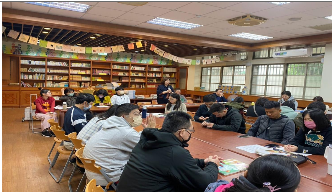
照片說明：校長主持 113 學年度第一學期學習扶助成果報告暨期末檢討會。