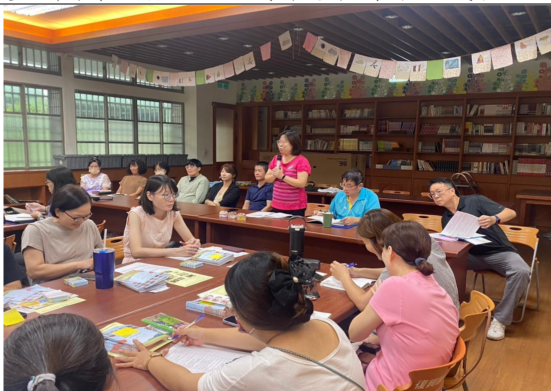
照片說明：校長主持 113 學年度-暑假學習扶助檢討會。