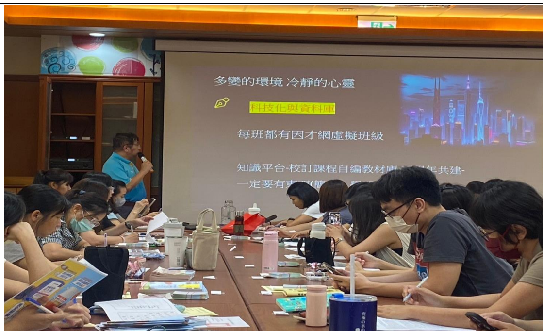
照片說明：校長主持 113 學年度第一學期期初暨學習扶助開課前會議-教務主任說明學習扶助開課時間及行事曆。