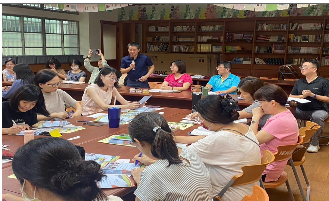
照片說明：113 學年度-暑假學習扶助檢討會，家長會長親自參與，感謝老師們暑假中為弱勢學生進行學習扶助。