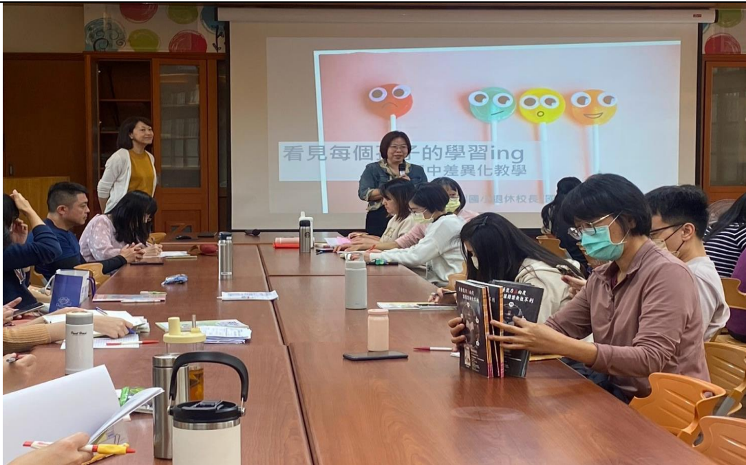
校長利用研習期間親自向全校教師說明差異化教學應用於學習扶助的重要性。

活動說明：以學習扶助篩選測驗及成長測驗學生測驗結果報告為依據，依學生落後進度進行個別化及適性化學習扶助教學。