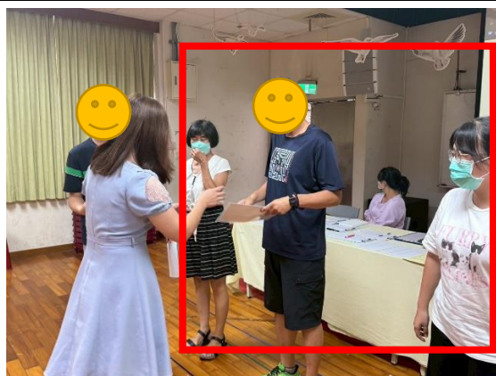
說明：學習扶助績優教師頒獎