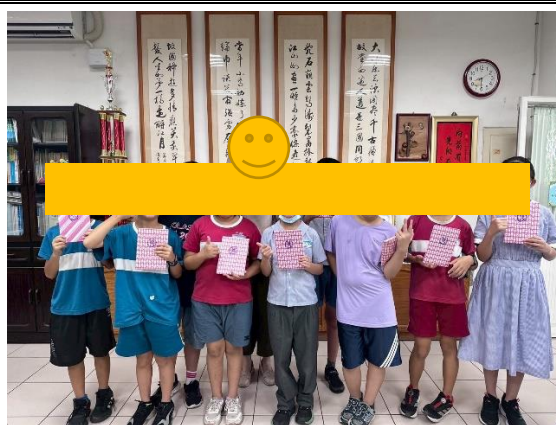
說明：受輔進步學生獎勵品頒獎