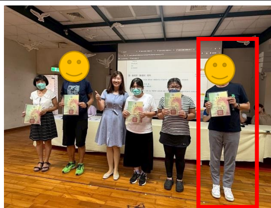
說明：學習扶助行政人員頒獎