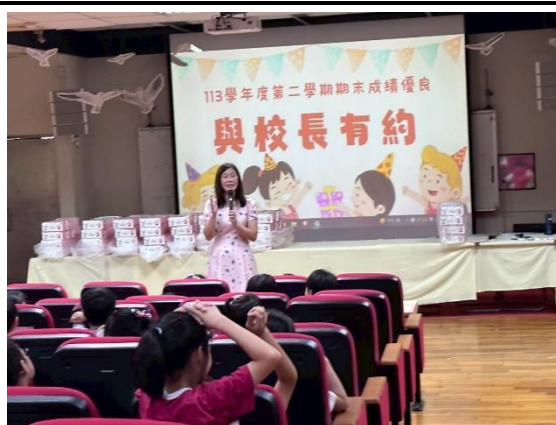
說明：受輔進步學生獎勵品頒獎_與校長有約