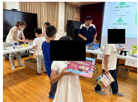
努力集點抽到小獎品