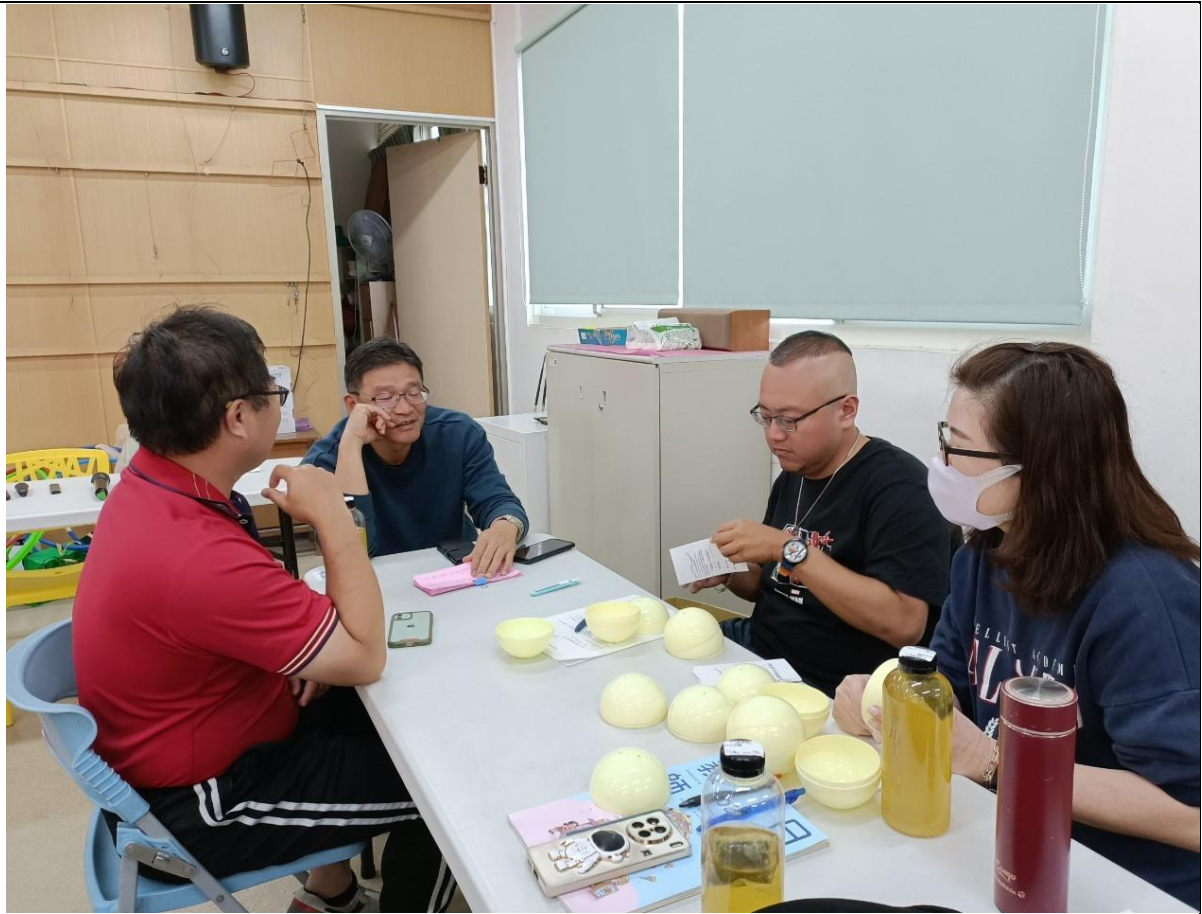
說明：校內教師社群時間交流教學心得