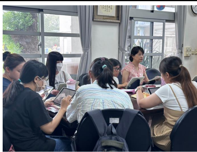
說明：老師們參與酷英研習