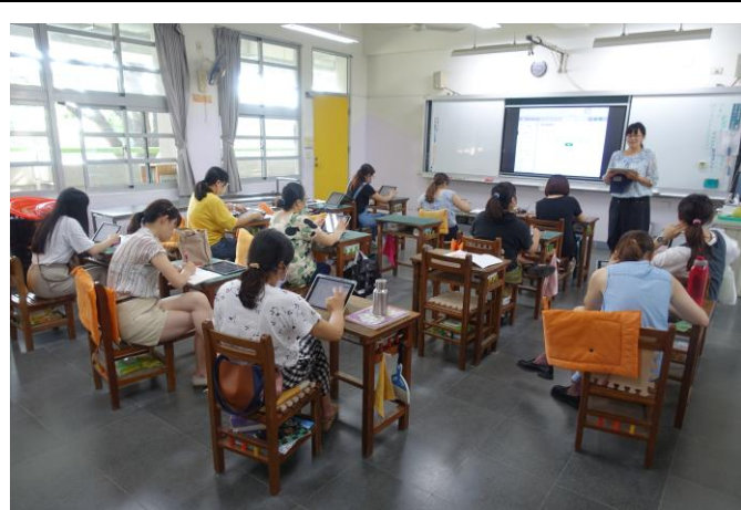
說明：老師進行將因材網運用於學習扶助