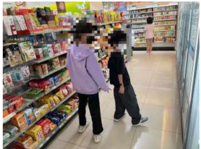
教師帶學生到便利商店實地教學