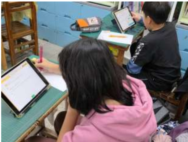
授課教師運用因材網