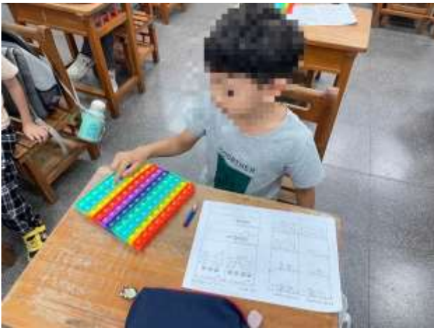
教師使用減鼠板指導數學加減