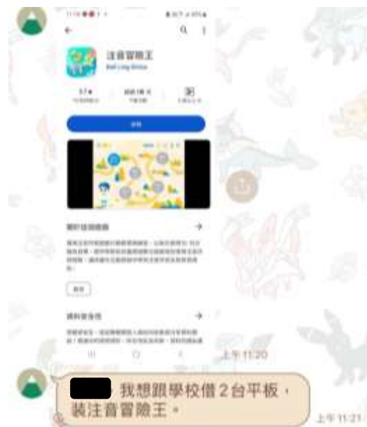
教師運用數位載具進行教學