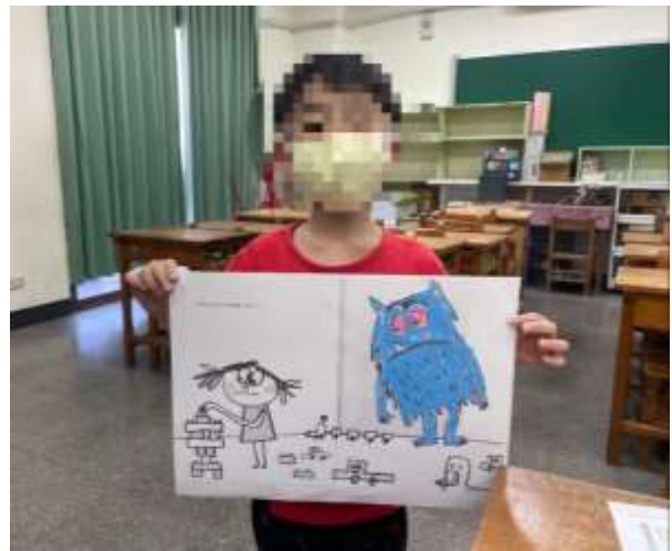
教師搭配繪本指導國語