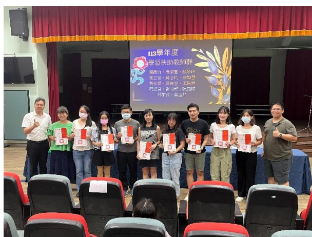
績優教師及行政人員