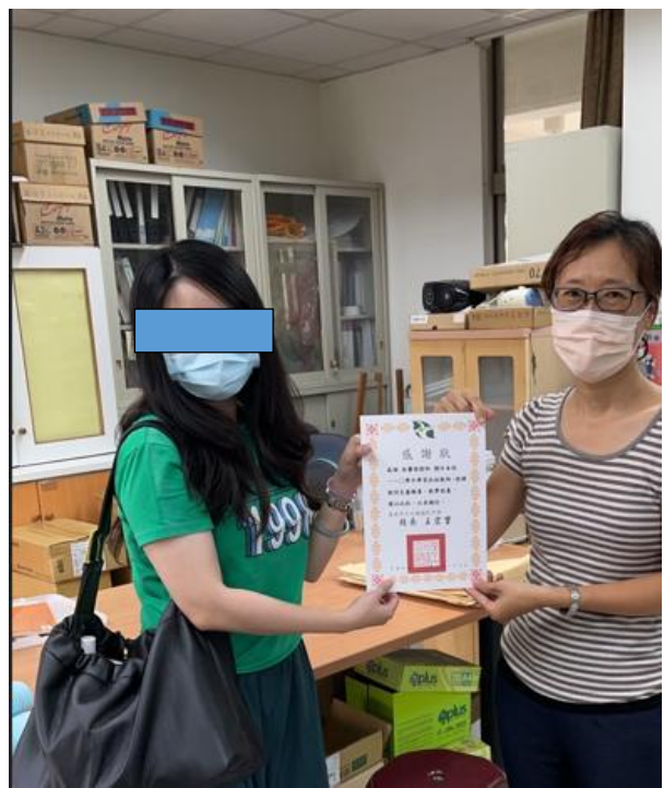
說明：教學組長頒發感謝狀予協助學習扶助課程之大學生教師。