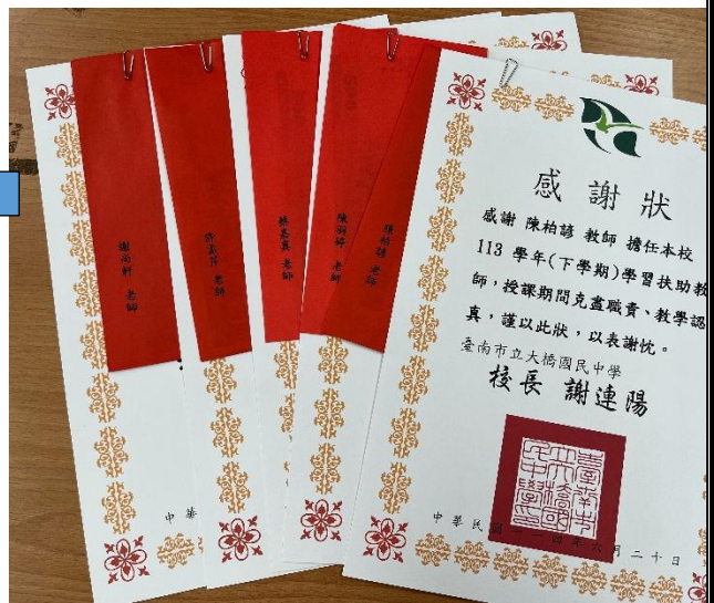
說明：每期學校均會製發感謝狀與家長會提供的禮金，感謝百忙中抽空協助學扶課程之教師。